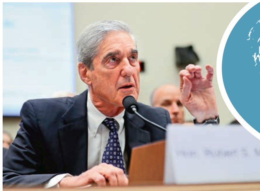
► 穆勒24日出席眾議院情報委員會的聽證會