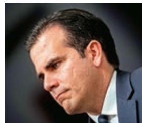
▲ 宣布辭職的波多黎各總督羅塞洛

在羅塞洛擔任總督期間，波多黎各2017年兩度遭逢颶風重創，造成約3000人罹難和大規模災損，而此前數個月，這個美國海外領地更