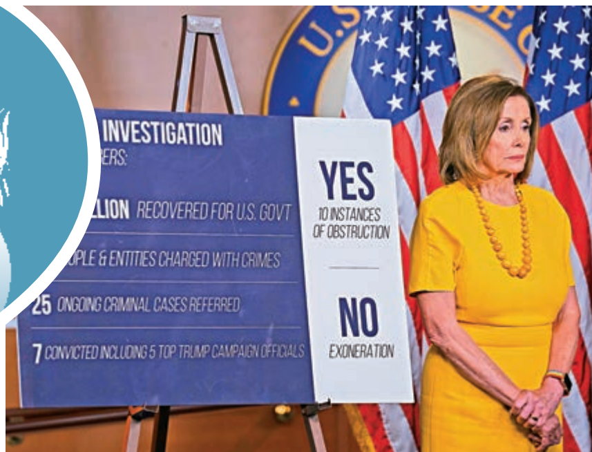
◀ 眾議院議長佩洛西在聽證會後的新聞發布會上說明情況

當日，穆勒先後出席了眾議院司法委員會和情報委員會召開的聽證會，過程通過電視轉播，歷時約7小時。穆勒重申，調查報告並未洗刷總統特朗普妨礙司法的罪責，但他也拒絕指控特朗普。他表示，司法部規定禁止起訴現任總統，暗示理論上特朗普卸任後可能會遭到起訴。