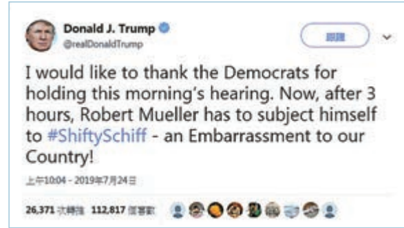
▲ 特朗普在聽證會後發推「感謝」民主黨人舉辦聽證會

特朗普一直以來指責穆勒的「通俄門」調查是由反特朗普的民主黨團隊領導的、政治迫害般的「獵巫行動」。對此，穆勒在聽證會中進行了強烈駁斥。穆勒說：「這不是獵巫行動。我已經幹這一行近25年了，在這25年中，我從未問過任何人他們的政治立場，從未有過。」