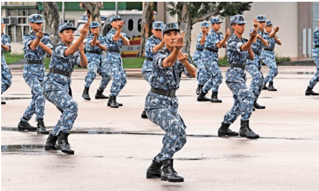
▲學員匯報表演岳家拳，展示十五天的學習成果