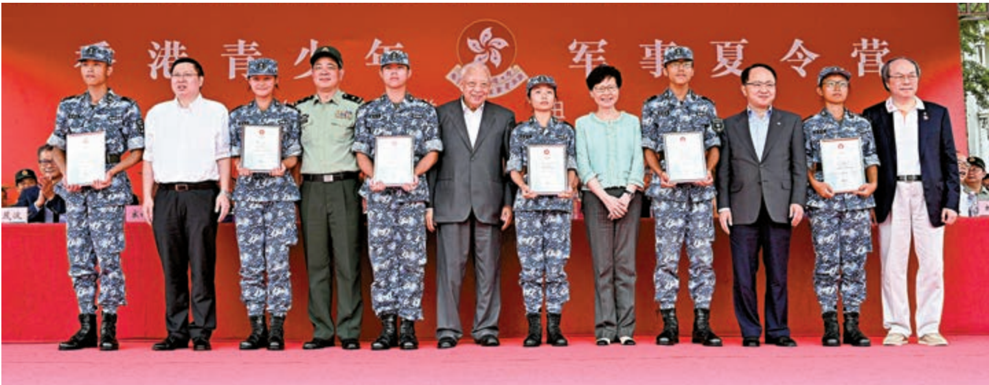
▲主禮嘉賓向贊助和支持機構代表頒發了感謝狀，並為學員代表頒發結業證書

最後，全體學生合唱《回歸頌》《強軍戰歌》並合影留念，為今屆軍事夏令營劃上了完美的句號。