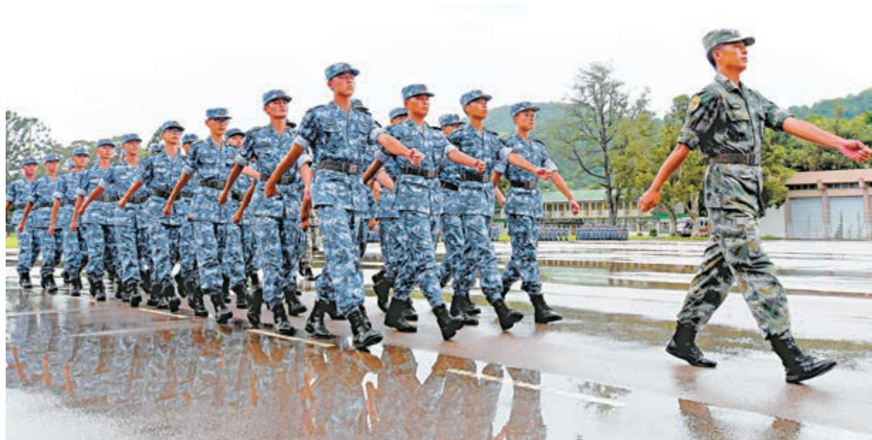
▲「迷彩小兵」穿着整齊制服進行列隊操