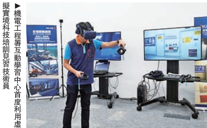
▶機電工程署互動學習中心首度利用虛擬實境科技培訓見習技術員