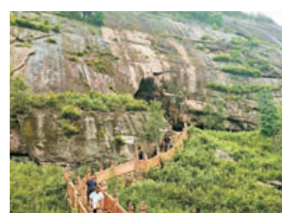
▲嘎仙洞其地峰巒層疊，樹木參天，松樺蔽日

嘎仙洞位於大興安嶺東麓，坐北朝南。拾階而上二十五米，洞略呈三角形，南北長九十米，高約二十多