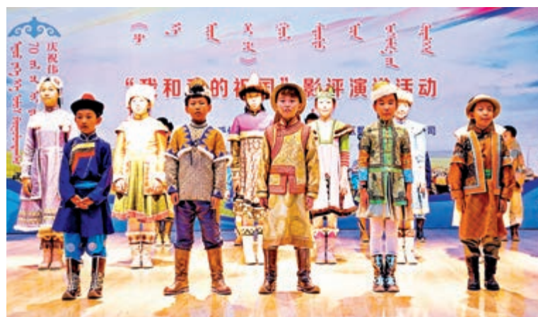
▲五彩呼倫貝爾合唱團是享譽全國的兒童合唱團 大公報實習記者鍾岡志攝

【大公報訊】實習記者何家寶、鍾岡志海拉爾報道：七月十一日下午，范長江行動內蒙古行採訪團來到位於海拉爾的呼倫小學。著名的五彩呼倫貝爾兒童合唱團就是出自呼倫小學，當日學生們展示了精彩的歌舞節目，體現出內蒙古的民族教育特色。