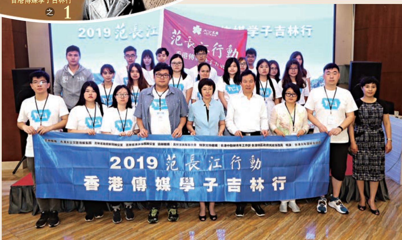
▲「2019范長江行動——香港傳媒學子吉林行」7月31日於吉林市舉行啟動儀式