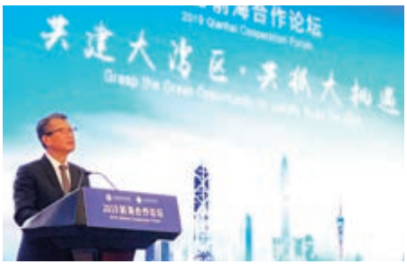
▲香港財政司司長陳茂波在深圳出席2019前海合作論壇並致辭

據介紹，特區政府已於去年8月開始為報關費設200元上限，進一步降低高價貨物進出口香港的成本，以配合推動貿易及物流業朝高增值方向發展，來往香港與粵港澳大灣區之間的高價貨物也可受惠。