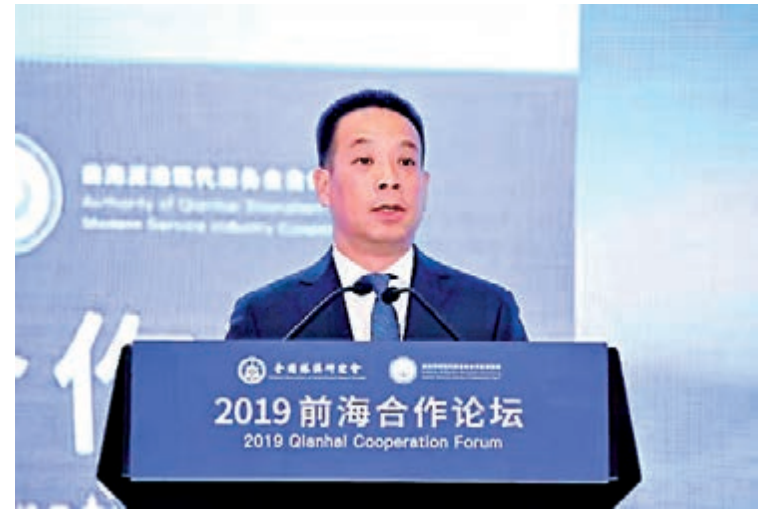
國務院港澳辦副主任黃柳權在二〇一九前海合作論壇致辭時表示，應充分發揮「一國兩制」獨特優勢

2019前海合作論壇2日在深圳舉行，來自中央政府、粵港澳三地的政、商、學、研界代表共同探討「共建大灣區，共抓大機遇」話題。國務院港澳辦副主任黃柳權致辭時表示，推動大灣區建設要始終堅持「一國兩制」，充分發揮「一國兩制」優勢，推動「一國兩制」的新實踐，以更加自信開放的姿態拓展新空間。外交部駐港特派員公署特派員謝鋒則表示，香港有克服困難的三大優勢和機遇，「一國兩制」事業一定會行穩致遠。與會專家表示，可把港澳地區的專業服務等優勢，與內地廣闊的市場和產業鏈等優勢結合起來。