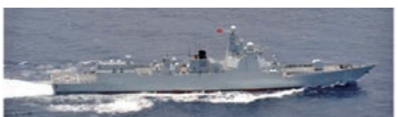
▲日本防務省拍攝到的解放軍052D型導彈驅逐艦117「西寧」艦、131「太原」艦

【大公報訊】據觀察者網報道：日本防衛省統合幕僚監部發布公告稱，8月1日，日本海上自衛隊發現此前赴西太平洋的兩支解放軍軍艦編隊匯合，組成六艦大編隊穿越宮古海峽北上進入東海。編隊包括