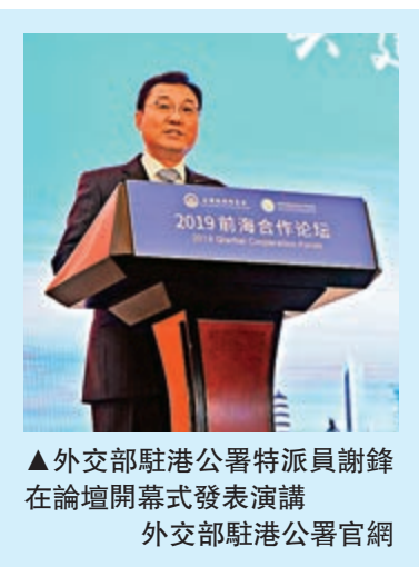
▲外交部駐港公署特派員謝鋒在論壇開幕式發表演講