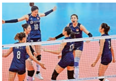
▲中國女排球員慶祝得分

首局初段，雙方都打出很高質量的進攻，比分一直僵持，雖然中國女排一直保持進攻水準，但無奈德國的防守實在太頑強，中國女排在第二個技術暫停以14：16落後。隨後中國女排上演逆轉好戲，依靠