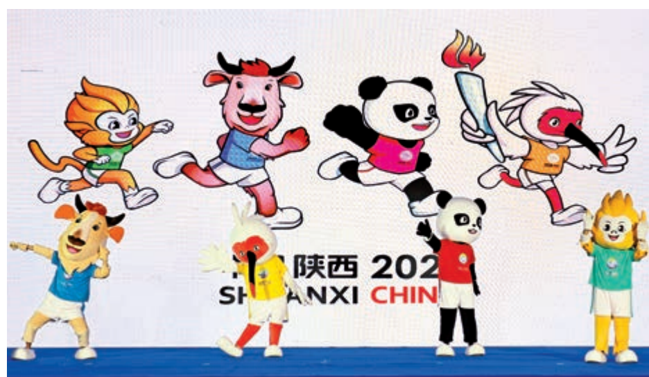
▲十四運吉祥物，左起：羚牛、朱鷲、大熊貓、金絲猴