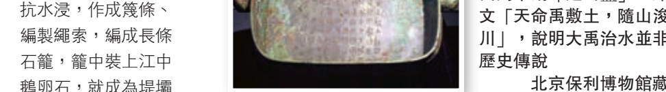
▲4 距今二千九百年前西周中期「遂公盃」，銘文「天命禹敷土，隨山浚川」，說明大禹治水並非歷史傳說