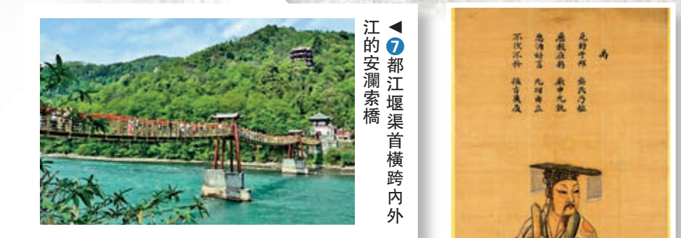
▲7 都江堰渠首橫跨內外江的安瀾索橋