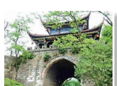
▲8 都江堰渠首玉壘山上玉壘關