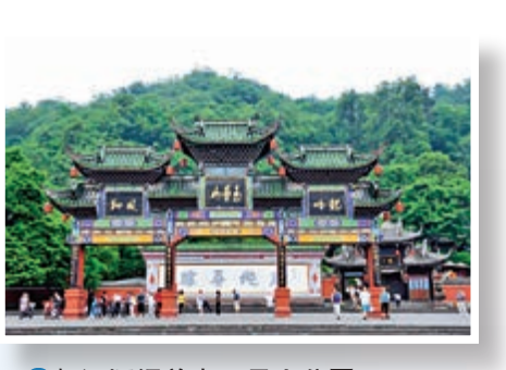
▲11 都江堰渠首處玉壘山公園