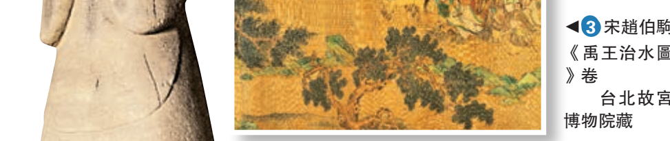
▲3 宋趙伯駒《禹王治水圖》卷 台北故宮博物院藏