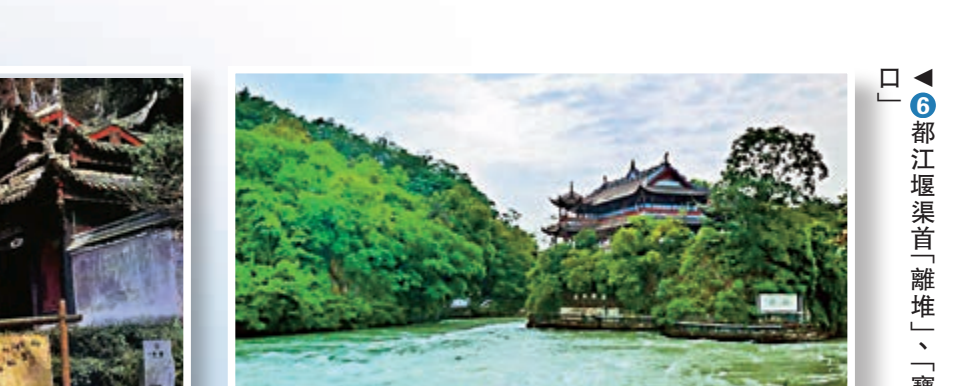
▲6 都江堰渠首「離堆」、「寶瓶口」