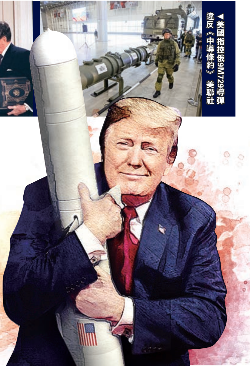
▲美國總統特朗普 設計圖片

俄羅斯科學院美國軍事問題專家佐洛塔廖夫說，俄美需要探索新的軍控機制，最好結果是兩國在行動上仍遵守條約規定並恢復對話。美國軍備控制協會執行主任金博爾認為，《中導條約》失效後，美國和北約必須認真訂制軍控計劃，才能避免在歐洲形成軍備競賽。德國漢堡大學專家屈恩預計美俄開新一輪軍備競賽將注重質量，尤其是在結合人工智能(AI)技術的新型自主武器系統研發領域。