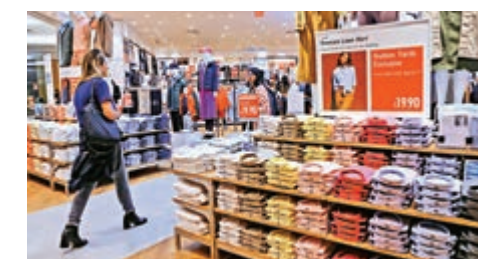
▲美零售相關行業協會反對特朗普政府威脅對中國商品加徵關稅