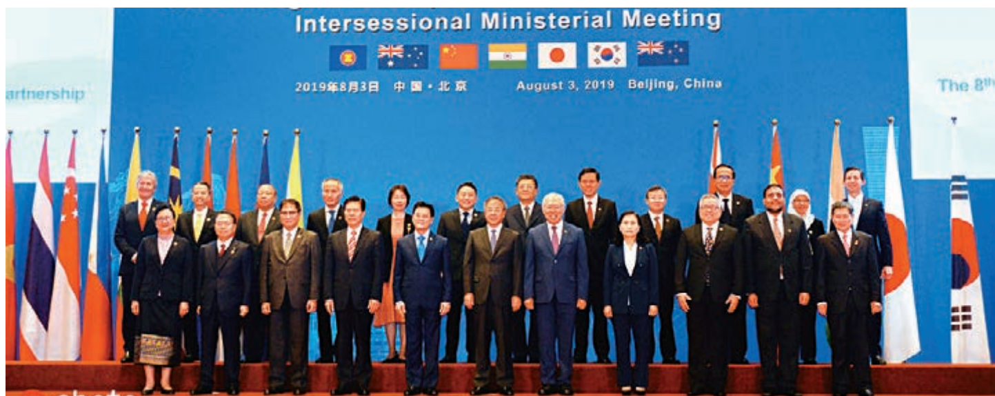
▲8月3日，《區域全面經濟夥伴關係協定》(RCEP)部長級會議在北京舉行。圖為與會代表進行大合照

RCEP談判於2012年由東盟發起，成員包括東盟十國、中國、日本、韓國、澳洲、新西蘭和印度。RCEP涵蓋47.4%的全球人口，32.2%的全球GDP，29.1%的全球貿易以及32.5%的全球投資，是當前亞洲地區規模最大的自由貿易協定談判。