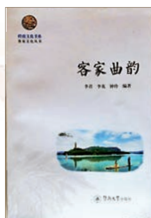
▲此書敘述客家各式音樂，內有專章講解漢樂