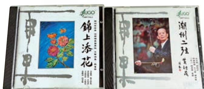
▲這兩張唱片都是潮州弦詩樂的優秀錄音，充分展現傳統特色

從上可見，由於選曲很新，香港樂迷鮮有聽聞。縱使音樂會希冀展現嶺南樂風，但所展者只不過是嶺南新風。音樂會缺乏慣聽的傳統樂曲，就很難牽動或凝聚香江情。再者，音樂會有不少樂曲在創作或改編方面呈現了各種嚴重問題，而那些問題可歸結為藝術智慧問題。