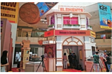
▲展場營造一個為兒童建造的可愛影院 ▲「夢幻隧道」

竹韻小集以「嶺南風·香江情」為題，七月在荃灣大會堂舉行音樂會，藉此慶祝十五周年。