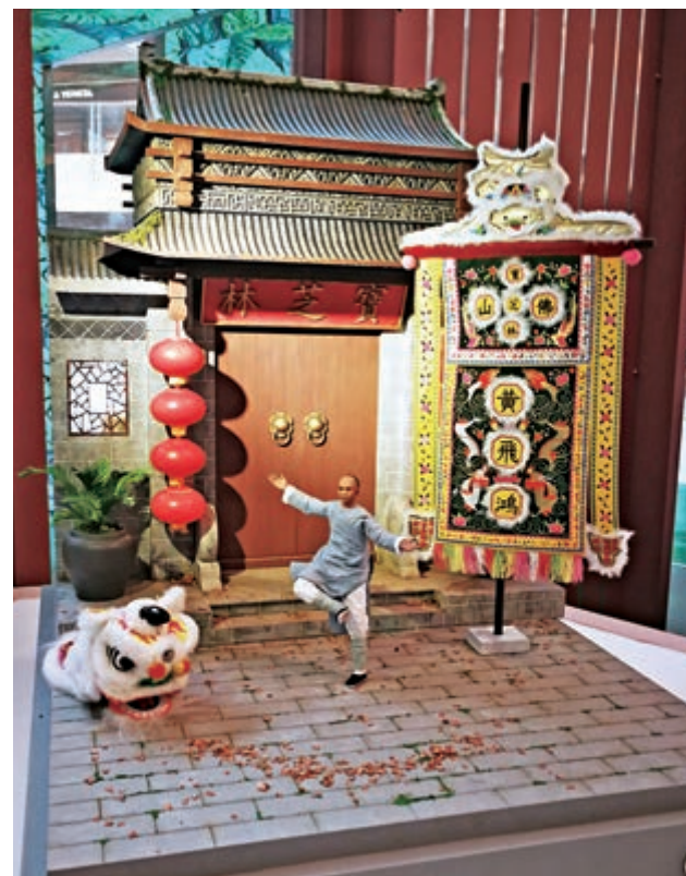
▲黃飛鴻威風凜凜地表演舞獅的情景