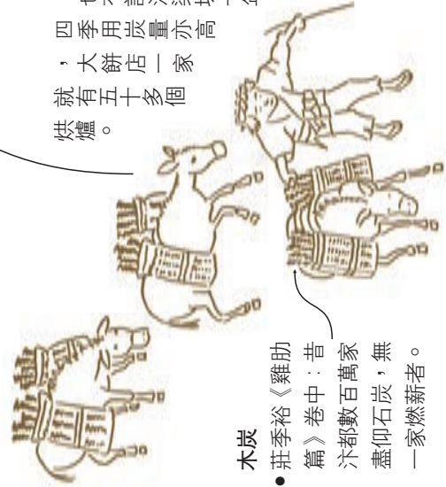
木炭 • 莊季裕《雞肋篇》卷中：昔汴都數百萬家，無一家不燃薪者。

帶領我們進入《清明上河圖》的是一隊驢子；五頭驢子身上都有兩個大袋子，有說牠們驮着的是木炭。踏入十月，汴梁城內需要大量的木炭取暖。有學者以此作為《清明上河圖》是描繪秋天景象的論證。也有說汴梁城一年四季用炭量亦高，大餅店一家，就有五十多個烘爐。