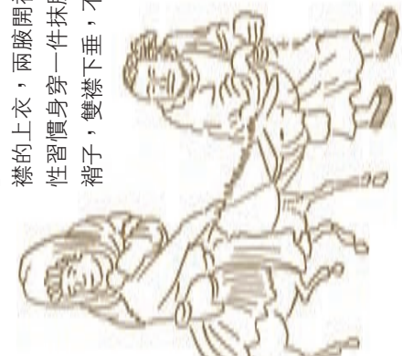
他騎的是驢非馬 • 毛驢是宋代最常見的腳力。由於宋朝沒有太多養馬地，馬很珍貴，一般市民代步、拉貨的腳力多用毛驢或騾子。

這隊旅人或許是外遊才把全身包裹，有說「抹胸+褙子」才是宋朝女性的典型裝束。褙子（背心）是直領對襟的上衣，兩腋開衩，短者及腰，長者過膝。宋朝女性習慣身穿一件抹胸（裹着胸部位置的裙裝），外套褙子，雙襟下垂，不繫帶、不扣紐。