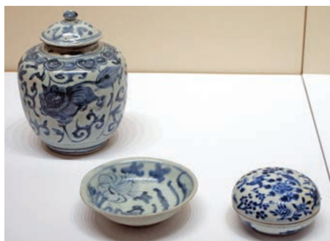
▲明、清民窰製作的青花瓷