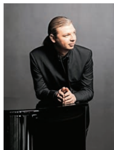
▲俄羅斯鋼琴家柯如信

柯如信於二十三歲奪得二〇一〇年伊利沙伯皇后比賽首獎，才華備受肯定。與他合作過的國際樂團包括阿姆斯特丹皇家音樂廳樂團、倫敦交響樂團、芝加哥交響樂團、倫敦愛樂樂團、費城樂團、三藩市交響樂團及指揮巴倫邦、格傑夫、尤洛夫斯基、歷圖等。今次他與香港小交響樂團合作演奏的拉赫曼尼諾夫第三鋼琴協奏曲，以其濃烈的情感表達和艱深的演奏技巧而著名，加上在不少電影如《閃亮的風采》中出現過，更令樂曲膾炙人口。這首別具詩意的樂曲，其