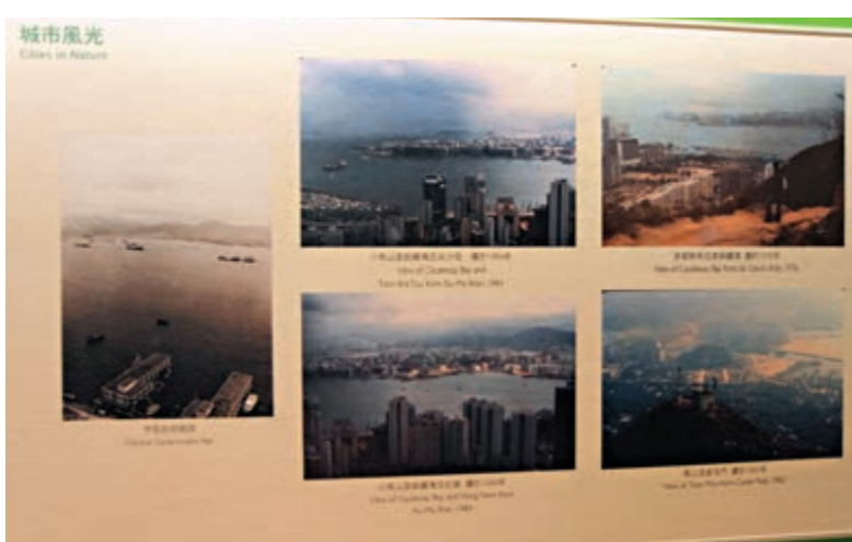
▲本地旅行家梁煦華攝影作品重現往日香港景色