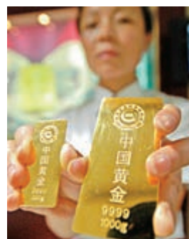
金價料仍有向上動力，央行料繼續增持黃金

持續影響，更多央行加入了購金的行列，特別是新興市場經濟體。得益於各國央行的持續購金行為，及黃金ETF流入量的上升，世界黃金協會發布的今年第二季度「黃金需求趨勢報告」稱，今年上半年，黃金需求增至2181.7噸，同比增長8%。