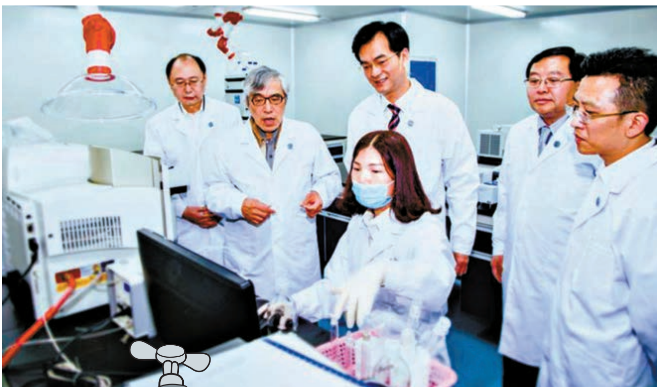
▲廣州市首筆科研資金成功跨境撥付港校，實現了大灣區科研資金跨境流動。圖為粵港科研人員一起做研究

據介紹，廣州市科技局與廣東省科技廳對接，與財政、稅務等部門以及銀行等金融機構研究科研資金跨境撥付工作流程、風險防控等問題，協助南方海洋科學與工程省實驗室開展科研資金跨境撥付。王越西說，南方海洋科學與工程省實驗室已於8月1日向香港科技大學成功撥付香港分部2019年建設經費3000萬元和港澳科研開放基金800萬元，此舉將進一步提升廣州市在粵港澳大灣區內整合創新資源方面的優勢，推動粵港澳大灣區科研合作，「從大學的評估來說，香港有很多世界頂級的大學，我們進行合作的話可以達到一個共贏的局面，互惠互利。」除了廣州市科技項目資金可以劃撥到