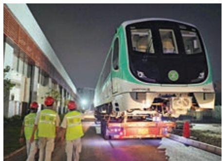
▲深圳地鐵6號線首列車運抵深圳

【大公報訊】記者郭若溪深圳報道：8月8日，深圳地鐵6號線首列車順利落軌長圳車輛段，標誌着6號線將全面進入車輛調試、系統聯調階段。6號線列車後續將以每月3列車的進度完成交付及列車調試，為線路明年年中開通試運作作準備。