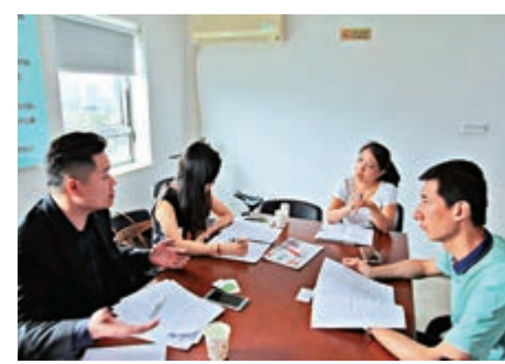
▲深圳消委會工作人員正在為消費者調解投訴

合作。「港人在深圳消費如果遇到糾紛可以等到返回香港後再投訴，這樣比以往要在當地投訴方便太多了。因為有時是回到香港才發現問題，對比時間和路程成本，很多時候就會選擇放棄追究，吃悶虧。」港人孫先生表示。