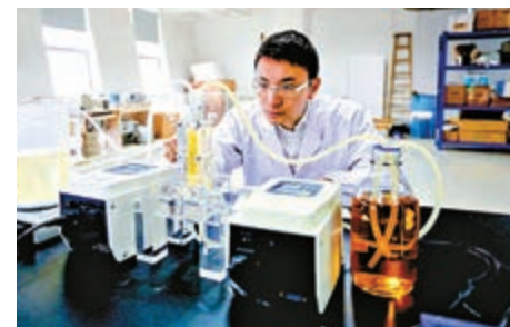
▲廣州科研實驗室裏，工作人員正在做實驗

負面清單設定禁止經費使用的條件，凡列入禁止類的經費使用情況一律不能進行開支。同時，負面清單以績效為導向，廣州市科技行政主管部門將定期對相關清單進行評估，根據評估情況適當調整。