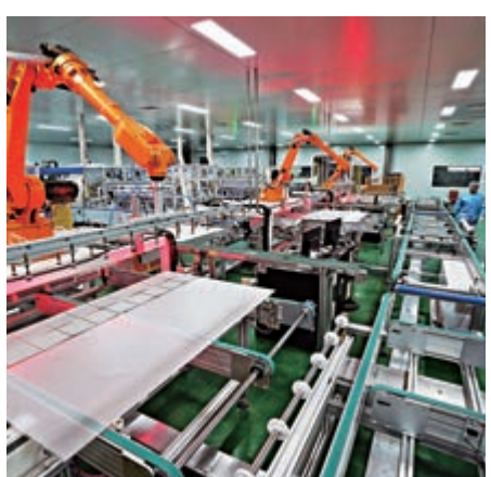
▲江西省德安一家能源公司在生產光伏組件

科技部表示，將進一步通過稅收減免等政策支持科技型中小企業，包括加大政策激勵力度，推動研究制訂提高科技型中小企業研發費用加計扣除比例、科技型初創企業普惠性稅收減免等新的政策措施。同時，進一步落實高新技術企業所得稅減免、技術開發及技術轉讓增值稅和所得稅減免、小型微利企業免增值稅和所得稅減免等支持政策。