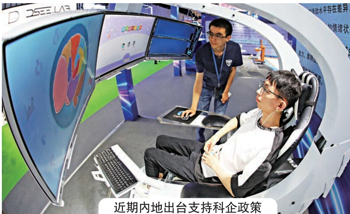
近內地地出台支持科企政策

與此同時，強化考核評估導向，將科技型中小企業培育孵化情況列入國家高新區、國家自主創新示範區等相關評價指標