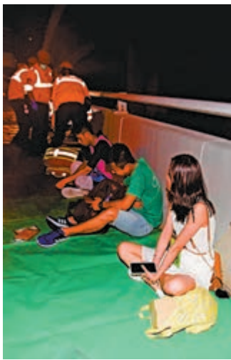
▲部分傷者坐在路旁待救治