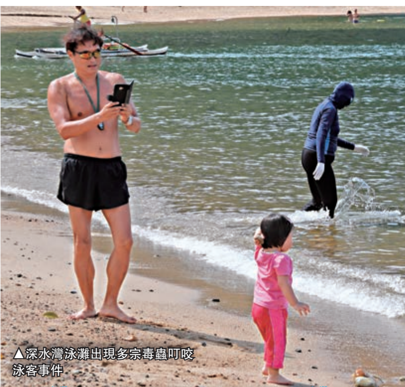
▲深水灣泳灘出現多宗毒蟲叮咬泳客事件