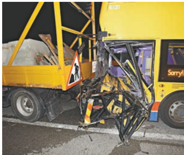
▲北大嶼山公路城巴撞工程車，城巴車頭嚴重毀爛

大丹尼士E500MMC、12.8米雙層巴士，上月24日通過檢修。涉事車長於2017年入職，上次休息日為上周六（本月10日），事發時為最尾一轉車。