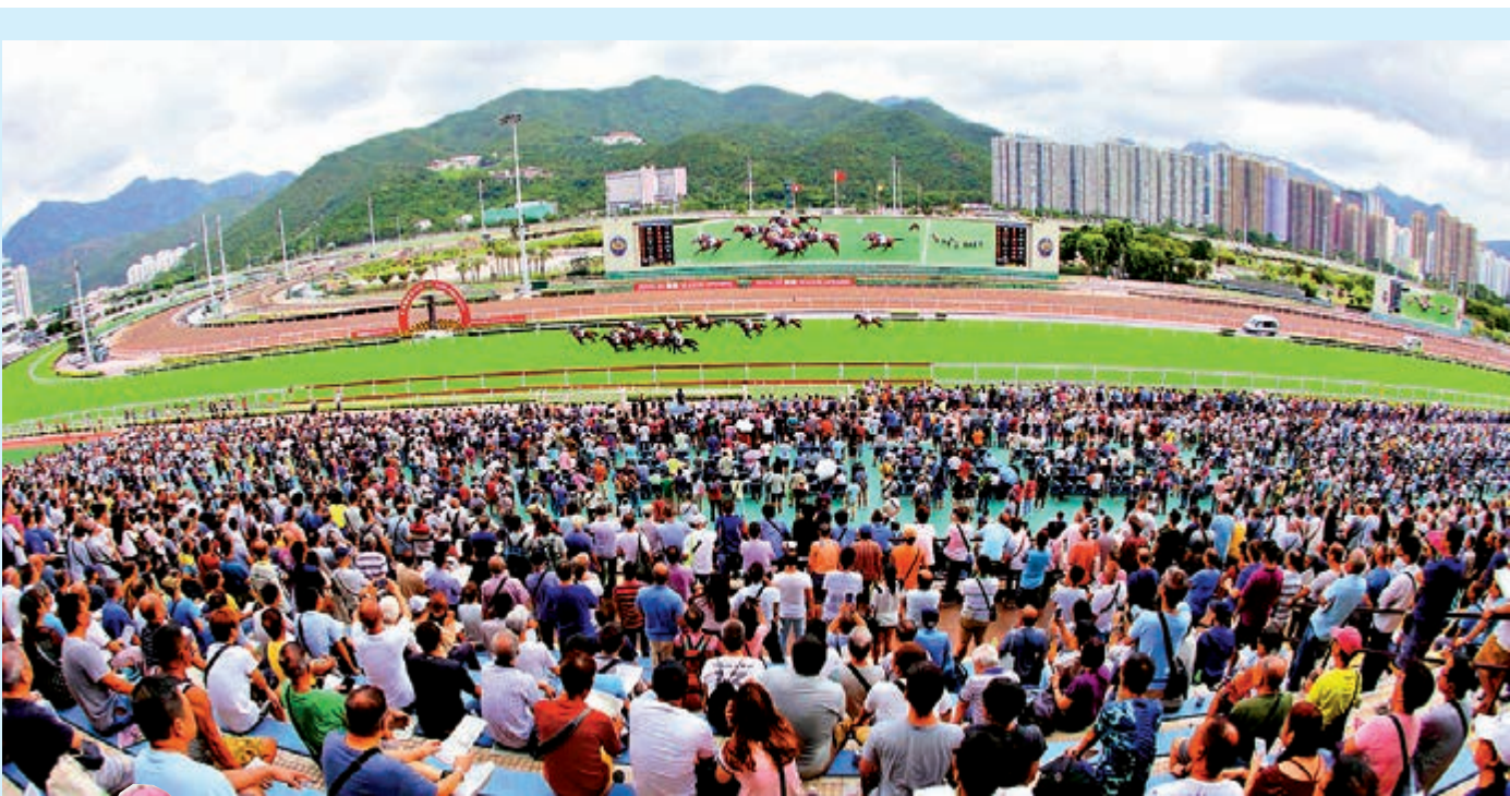
12億元，按年升2.8% 馬場成為難能可貴的「避風港」，馬季開鑼日投注額高收逾

馬會行政總裁應家柏表示，目前香港正處於一個具挑戰性的時刻。昨日馬場有6.8萬人入場，「在馬場見到充滿正能量，令人欣慰」，也反映香港賽馬活力蓬勃。至於單日投注額同樣超乎預期，主要是匯合彩池投注額從去年同期的1.58億元提升到2.09億元。