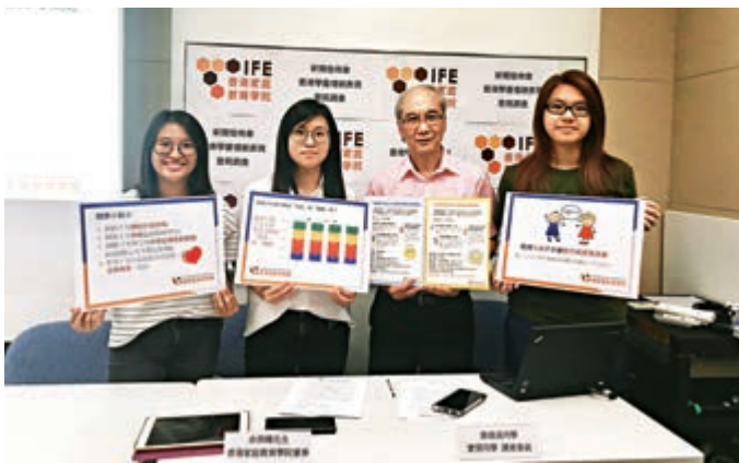
▲「香港學童禮貌表現」調查指超九成學童駁斥或責罵長輩

【大公報訊】記者黎慧怡報道：「養不教，父之過。」孩子無禮貌，家長負有不可推卸的責任。上月一項調查顯示，超九成學童會駁斥或責罵長輩，而逾七成家長認為培育禮貌孩子非家庭教育最大責任。有專家指出，家長的行為對子女影響很大，並呼籲家長多關注子女在學業成績以外的品德教育。