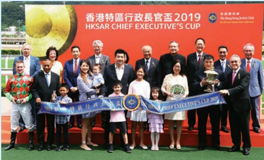
▲香港特區行政長官盃頒獎儀式大合照