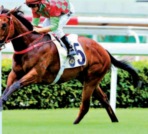
▲「帝豪福星」勝出香港特區行政長官盃