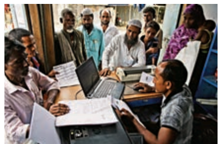
▲印度阿薩姆邦居民8月31日檢查自己是否被列入公民冊

許多人認為，印度最終將造就一大批無國籍人羣，引發本土危機。他們很可能被驅逐出境，但鄰國孟加拉也未必願意接納，外界憂慮緬甸羅興亞人的悲劇再次上演。