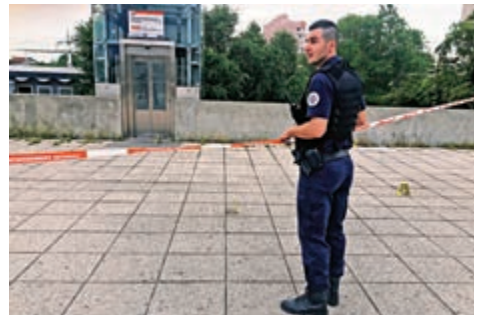
▲法國維勒班警方封鎖阿富汗刀客行兇後的現場

鄰里昂的維勒班市一處地鐵站附近持刀襲擊路人，造成1死8傷，其中3人傷勢嚴重。行兇者當場被過路人制服，隨後警方趕到。刀客向警方說，身份證沒隨身帶。他又向警方講述了自己三個不同的身份，不知哪個是真的。警方在現場找到了兇器，其中還包括一把烤肉叉子。