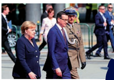
▲德國總理默克爾（左）9月1日出席華沙的紀念儀式

8月30日，就是特朗普取消行程的第二天，總理莫拉維茨基宣布了美軍駐紮的六個地點，可惜未獲特朗普現身加持，宣傳效果大打折扣。