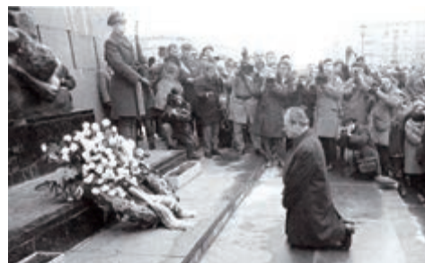
▲西德總理勃蘭特1970年訪問波蘭時向猶太人紀念碑下跪

勃蘭特在管理西德期間，一直積極倡導民眾「正視歷史」，並開始保護集中營等納粹遺址，營建博物館，組織紀念活動。德國也因此樹立起反思歷史，勇於贖罪的形象。