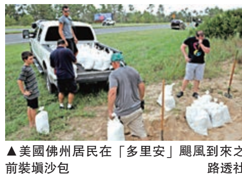
▲美國佛州居民在「多里安」颶風到來之前裝填沙包

8月30日，美國總統特朗普對外暗示，8月31日他會待在大衛營，與氣象專家一起監視「多里安」的動向，9月1日他將飛回華府聽取聯邦緊急措施署（FEMA）的簡報，但事實上，他8月31日飛去了佛吉尼亞州高爾夫球場，白宮發言人格里沙姆解釋道，總統特朗普將「每小時聽取簡報」。