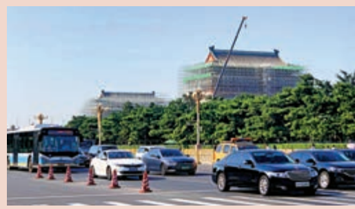
▶天安門廣場南側的正陽門和前門外圍圍起腳手架正在施工