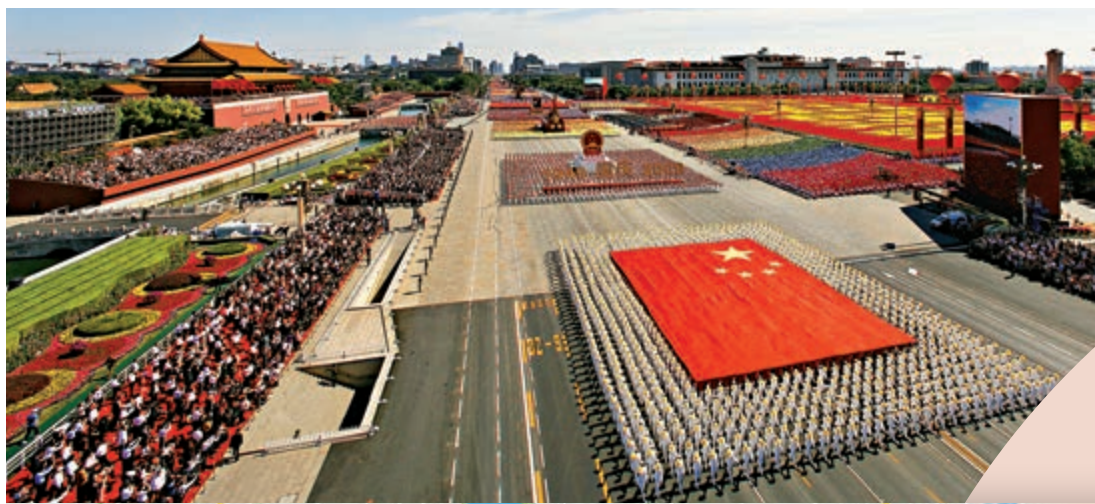
◀2009年國慶60周年大會在天安門廣場隆重舉行，儀仗隊高擎五星紅旗通過天安門廣場