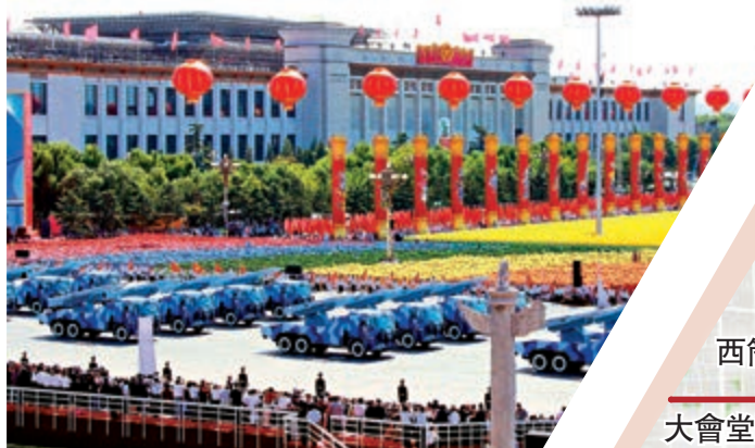
▲這是國慶60周年大會閱兵分列式中的海軍艦空導彈方隊正在通過天安門廣場 資料圖片

，在北京天安門廣場將隆重舉行慶祝中華人民共和國成立70周年大會以及盛大的閱兵式和群眾遊行。10月1日晚，在北京天安門廣場舉辦首都國慶聯歡活動。此外，還將頒授國家勳章和國家榮譽稱號；舉行向人民英雄敬獻花籃儀式；舉辦國慶招待會；舉辦國慶文藝晚會；舉辦慶祝中華人民共和國成立70周年大型成就展等活動。