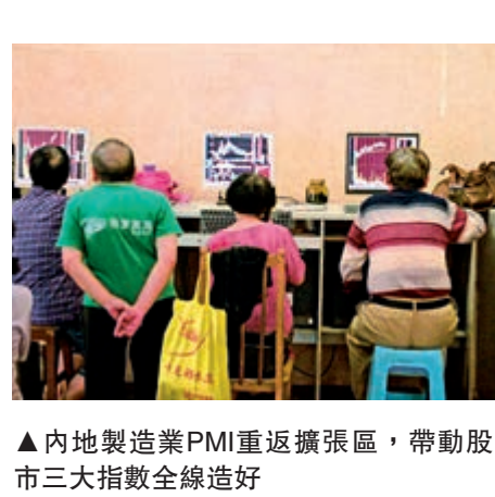
▲內地製造業PMI重現擴張區，帶動股市三大指數全線造好

A股方面，三大股指昨日全線走強，滬綜指收漲1.31%，收復2900點整數關口，報2924.11點；深成指上漲2.18%，收報9569.47點；創業板指上漲2.57%，收報1652.29點。兩市合計成交5532億元（人民幣，下同）；北向資金淨流入58.83億元。分析稱，投資者的冷靜態度說明，貿易戰對中國市場的影響已基本被消化。此外，市場也受十一假期之前利好措施的預期提振。