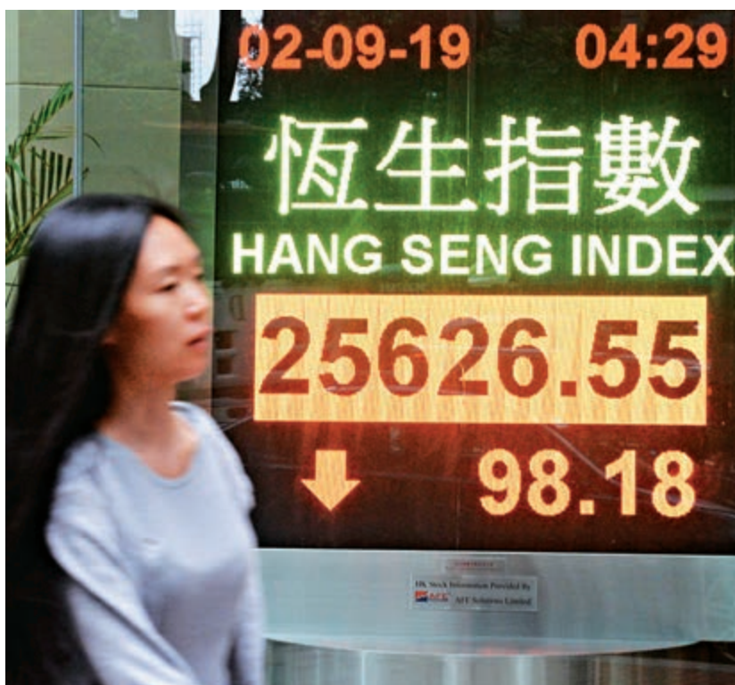
▲受地產股下跌拖累，港股昨日再跌近百點

整體大市方面，恒指昨日反覆跌98點，報25626點；國企指數逆市升20點，報10103點。主板成交額大幅縮減22%，至678億元。其他個股表現，旅發局數字顯示，7月份訪港旅客按年下跌4.8%；8月份上半個月訪港旅客數字下跌約三成。酒店股向下，華大酒店(00201)股價跌6%，報0.141元；香格里拉股價跌3.6%，報7.89元；朗廷(01270)股價跌3%，報2.24元。