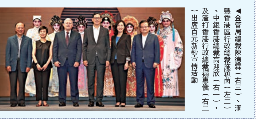
▲金管局總裁陳德霖(右三)、滙豐香港區行政總裁賴穎(左一)、中銀香港總裁高淑欣(右二)及渣打香港行政總裁胡恩儀(右二)出席百元新鈔宣傳活動