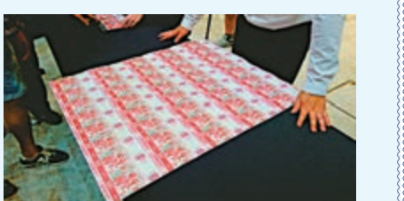
▲三家發鈔行的100元新鈔，圖為滙豐銀行的設計：梨園粵韻

「2018香港鈔票系列」共有五款面額，其中1000元和500元新鈔已於今年初推出，並於市面流通。至於其餘兩種面額的鈔票，即50元和20元鈔票，預計於明年初發行。金管局表示，舊版鈔票繼續為法定貨幣，與2018系列鈔票同時在市面流通。