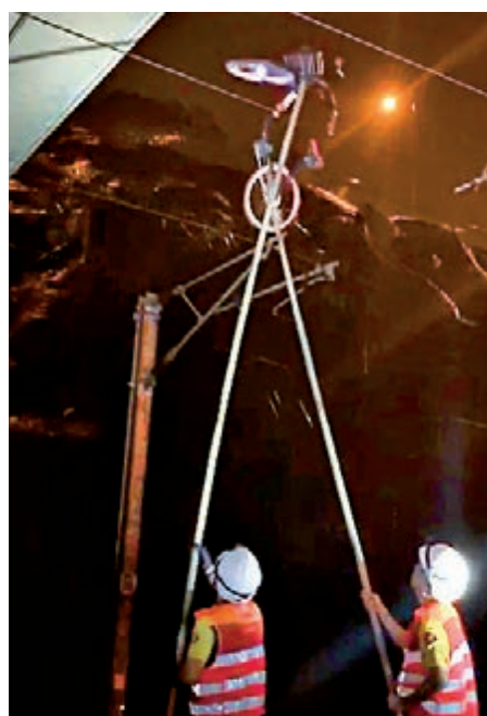
▲港鐵職員利用長桿，清走掛在高壓架空電纜上的共享單車