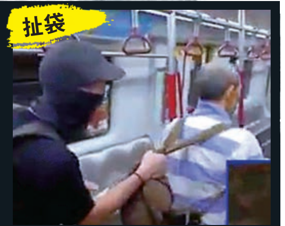
▲暴徒拍打站長，並將他推倒在地，站長眼鏡飛脫