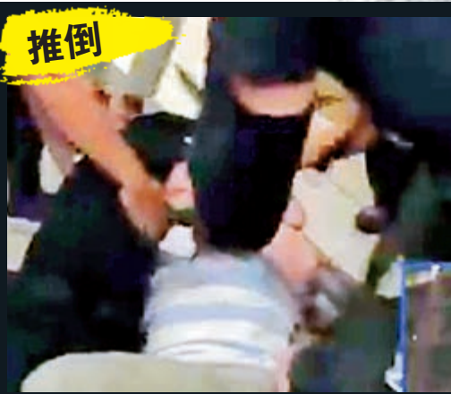
▲多名黑衣蒙面暴徒在車廂內包圍休班站長