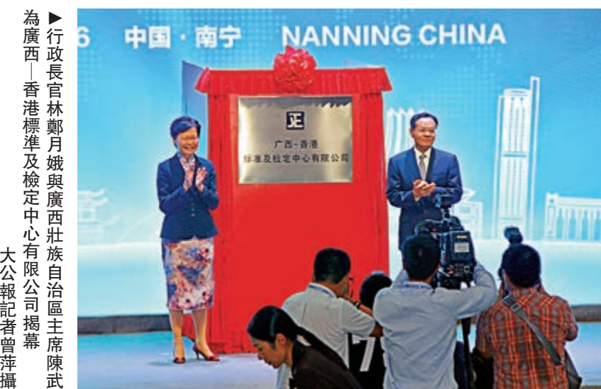
行政長官林鄭月娥與廣西壯族自治區主席陳武為廣西—香港標準及檢定中心有限公司揭幕