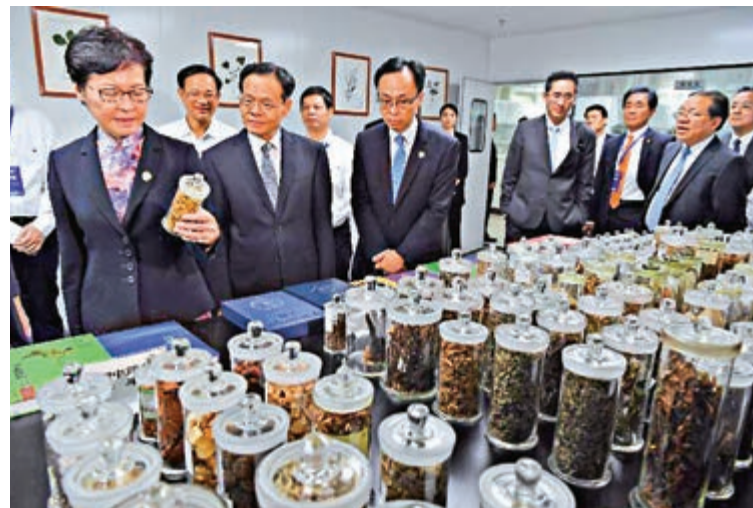
行政長官林鄭月娥在南寧了解檢驗檢測實驗室運作

會議還確定加強產業深度協作，構建區域協同的產業體系和創新網絡；深入推進區域旅遊合作，打造泛珠區域21世紀海上絲綢之路之旅、海峽之旅、邊境之旅、郵輪之旅等跨省（區）「一程多站」精品旅遊線路；加快推進市場一體化建設，探索建立泛珠內地9省區信用合作機制，完善統一的區域市場規則體系，推動跨地區市場監管共治；建立健全流域生態保護補償機制，推進環境污染和生態破壞聯防聯控聯治等重點合作內容。