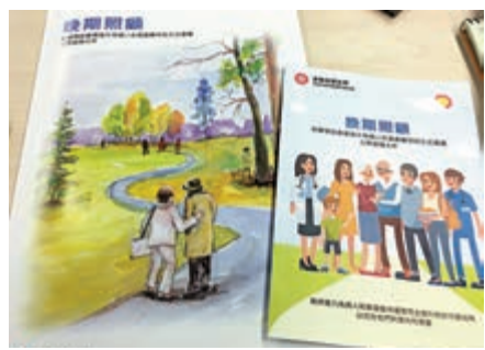
▲食衛局就晚期照顧的相關立法，昨日展開三個月公眾諮詢