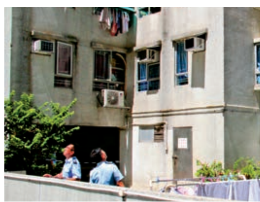
▲墮樓中年婦人的屍體用帆布遮蓋