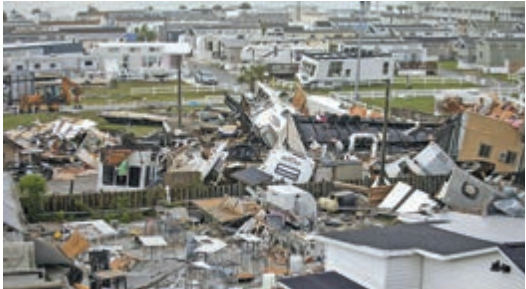
▲北卡羅來納州翡翠島的移動房屋5日因颶風嚴重損毀

美東時間6日早8時，「多里安」風眼以每小時22公里的速度向東北方向移動，逼近北卡羅來