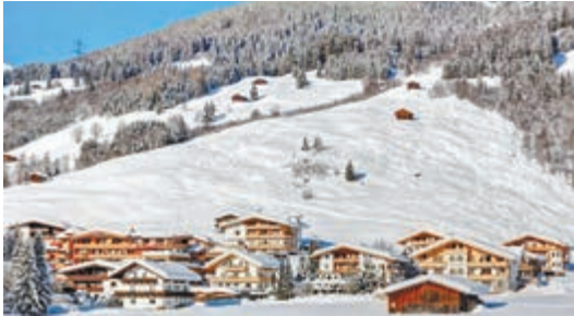
▲被起訴酒店位於奧地利蒂羅爾州蓋洛斯

根據法庭文件，被起訴的德國男子被稱為「托馬斯·K」，他與妻子去年8月入住位於奧地利蒂羅爾州蓋洛斯的一間酒店，在入口處發現兩張畫像，分別展示一位身著納粹時期德意志國防軍