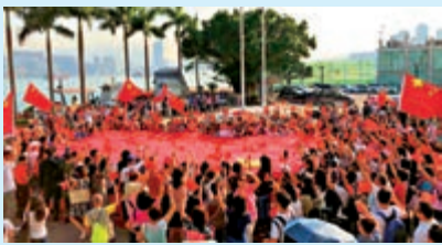
▲部分市民高呼「祖國萬歲」 互聯網 ►由學生組成的升旗隊護旗手在國旗和區旗前合照 香港升旗隊總會供圖