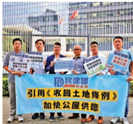
▲民建聯六名成員昨晨到政總外請願，向政府代表遞交請願信

民建聯六名成員昨晨到政總外請願，向政府代表遞交請願信，要求政府在新界新發展區引用《土地收回條例》，增加中短期土地供應，用作興建公營房屋，縮短公屋輪候時間。 他們指出，按政府現時掌握的土地，假設所有覓得土地能如期推出作建屋之用，未來10年亦只能興建約24.8萬個公營房屋單位，較新目標31.5萬個仍相差6.7萬，缺口較未修改《長策》公私營房屋比例前的4.3萬伙更多，反映提高目標，只是畫餅充飢。 民建聯認為要落實《長策》供應目標，必