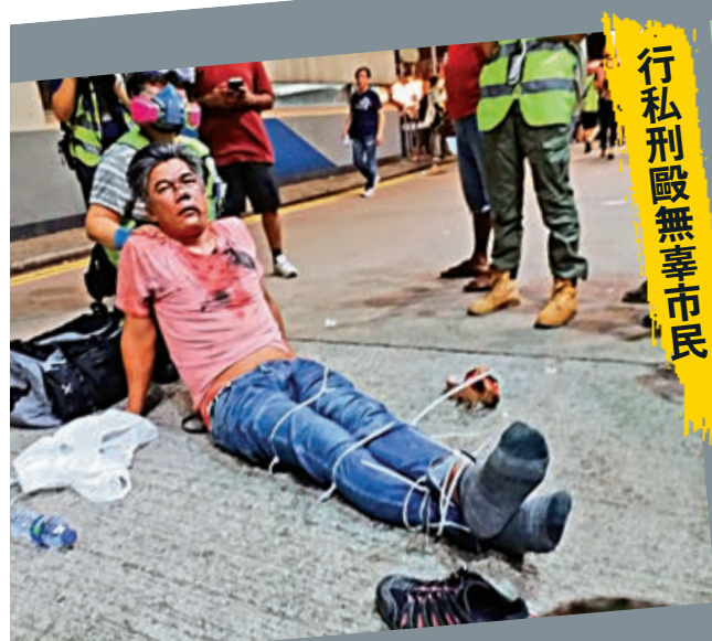
行私刑毆無辜市民

連續三個月，暴亂持續不休，即使特區政府已宣布撤回修例，暴徒仍不肯收手，反而更有針對性地攻擊警察，又瘋狂破壞交通設施。國務院港澳辦發言人楊光曾於上月指出，香港已開始出現「恐怖主義苗頭」。根據香港2002年通過的《聯合國（反恐怖主義措施）條例》，「恐怖主義行為」具有針對人的嚴重暴力，對財產的嚴重損害；嚴重干擾或嚴重擾亂基要服務、設施或系統；以及意圖強迫特區政府等特徵。近日有搞事者公然在網上承認自己就是恐怖分子，狂言將製造港版「9·11」恐襲。本港各界認為，特區政府必須嚴厲打擊任何違法犯罪行為，絕不能讓恐怖主義在香港蔓延，否則動亂無休無止，亂局更難控制。