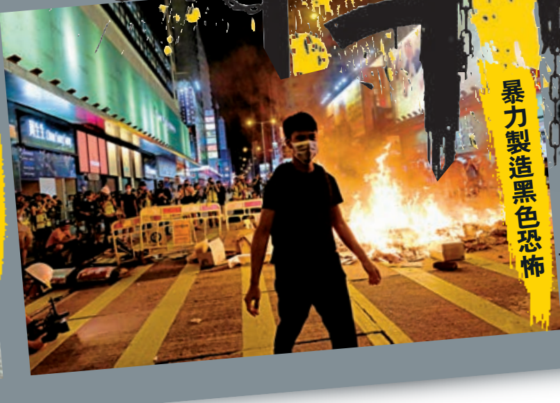
暴力製造黑色恐怖