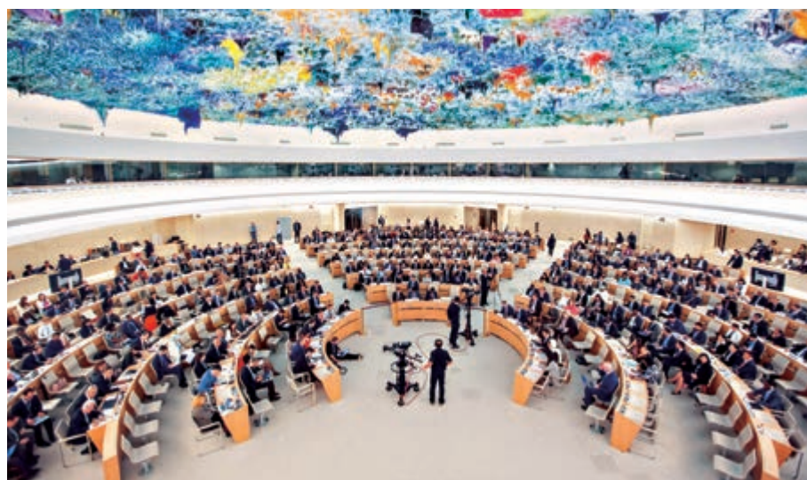
聯合國人權理事會將於明日在瑞士日內瓦舉行例會