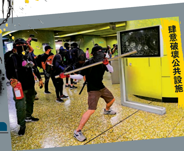
肆意破壞公共設施