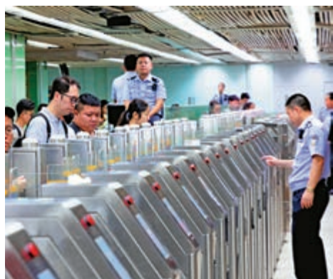
▲圖為從深圳去往香港的旅客通過羅湖口岸邊檢 資料圖片