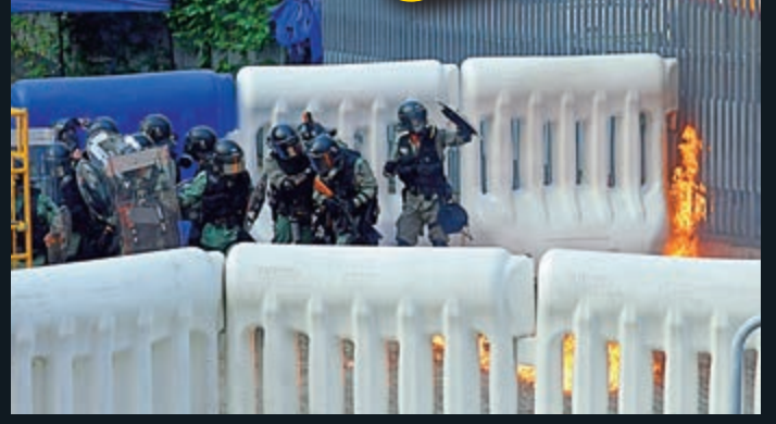
地點：金鐘、灣仔一帶 攻擊對象：在人群間向警員近距離正面投擲汽油彈