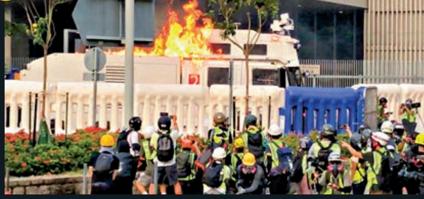
地點：政府總部外圍 攻擊對象：向水炮車投擲燃燒彈，圖破壞警方驅散人群工具