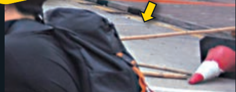
地點：堵路路障前 攻擊對象：拉鋼線絆倒清理路障的前線警員