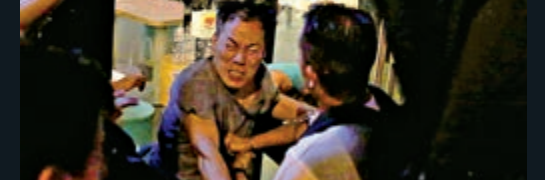
地點：炮台山、北角一帶 攻擊對象：「快閃」群毆不同政見的街坊及市民