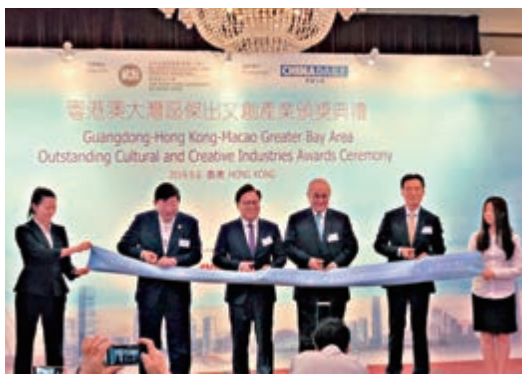
▲眾嘉賓於頒獎典禮合照