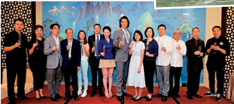
▲香港文化節傳媒簡介會眾嘉賓與藝術家合影留念