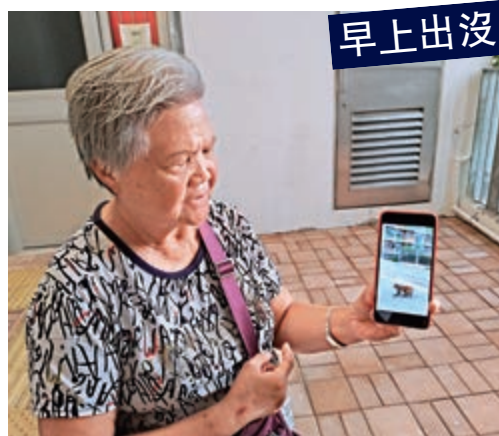
▲杜婆婆向記者展示她拍下的照片，指野猴大約早上七時多就會出沒