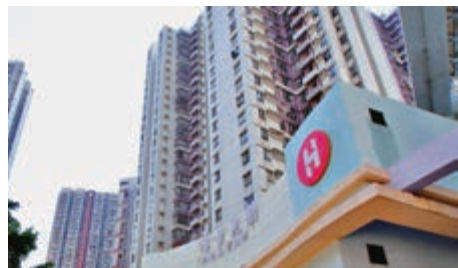
▲房協初步評估合資格長者業主，來自11個住宅發售計劃屋苑的1310個單位

《倡導書》提出多項協助青年置業，包括在樓價回復平穩時放寬首置者的樓宇按揭貸款，協助年輕人置業；提高「家有兒童」家庭的揀樓優先，鼓勵港人生育及回應青年家庭住屋需求；推出「港人首置港樓」先導計劃，透過於賣地計劃中撥出部分土地，規定發展商日後興建的私樓單位，只能售賣予首次置業的港人、青年人等。