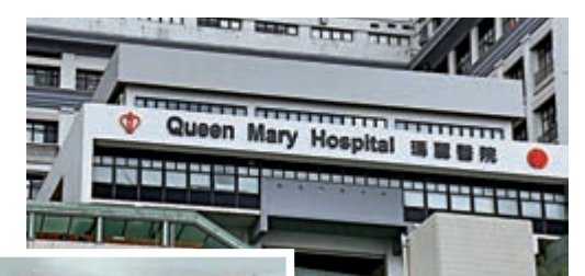
▲瑪麗醫院發現有洗腎病人曾使用Pro-Medi Prosept消毒藥水，感染洋蔥伯克氏菌

，「Prosept」消毒藥水於市面藥房、藥妝店均有出售，腎病病人本身要在家居洗肚，進行洗肚前將接駁導管口消毒，如果使用受污染的消毒藥水，就可能將細菌帶入體內。他稱，洋蔥伯克氏菌常見於水、泥土及植物，對健康正常人士不會構成威脅，但腎病病人免疫力較差，感染後可能會引起腹膜炎，甚至敗血症等嚴重併發症，嚴重可導致死亡。