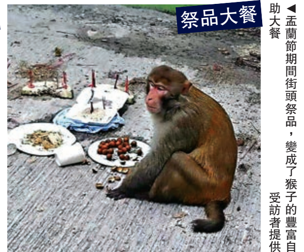
祭品大餐 孟蘭節期間街頭祭品，變成了猴子的自助餐