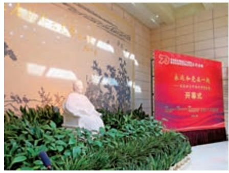
▲24日，宋慶齡同志故居修葺一新，重新開放

、迎接曙光、人民領袖、心繫人民、和平使者、締造未來、國之瑰寶。附錄部分向讀者普及了中國宋慶齡基金會、「小先生」的基本知識，並帶領讀者領略全球各地宋慶齡紀念地的風貌。讀本中還配有妙趣橫生的「話劇表演」，通過探究、體驗、互動等形式，將愛國主義教育轉化為主題特色活動，潛移默化地影響學生的情感、態度、價值觀。