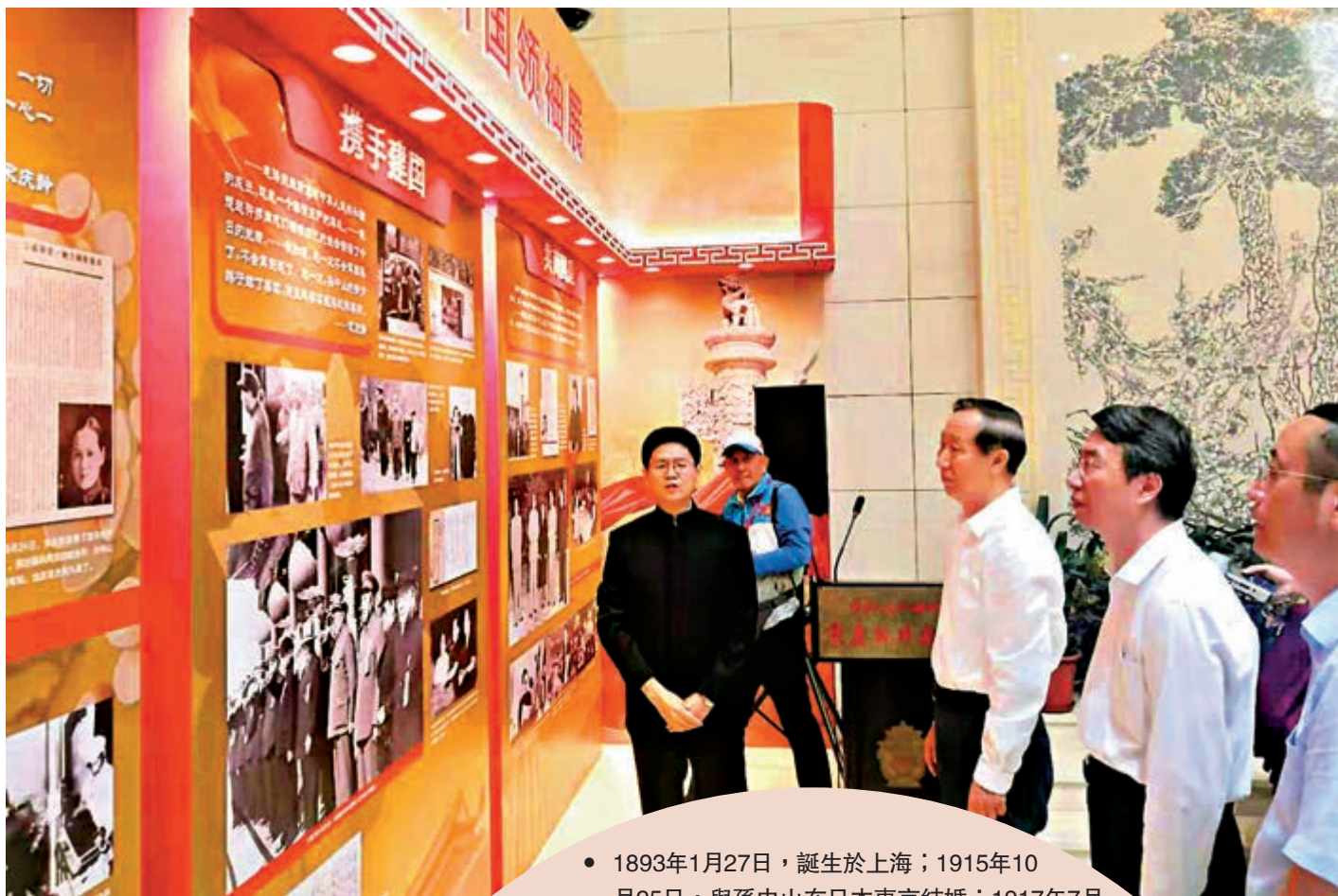
▲23日，中國宋慶齡基金會主席王家瑞參觀宋慶齡生平介紹

于群說，少年強，中國強。青少年是國家的未來和民族的希望。我們要進一步弘揚宋慶齡精神，講好新中國的故事，充分激發中華兒女特別是青少年的愛國情、強國志、報國行，助力少年兒童健康成長，打造新時代「三毛樂園」，努力培養肩負民族復興使命的時代新人。