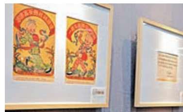
▲宋慶齡與張樂平漫畫紀念展珍貴展品