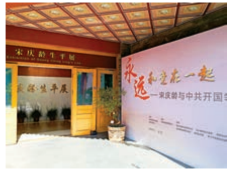
▲宋慶齡與中共開國領袖展在京開幕