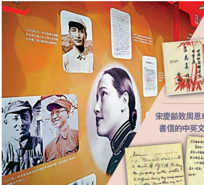
▲宋慶齡與中共開國領袖展現場展版