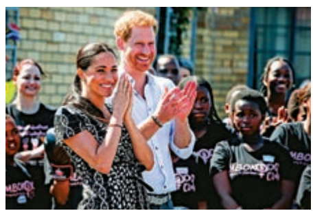
▲哈里王子(右)和梅根夫婦23日在開普敦尼揚加出席活動