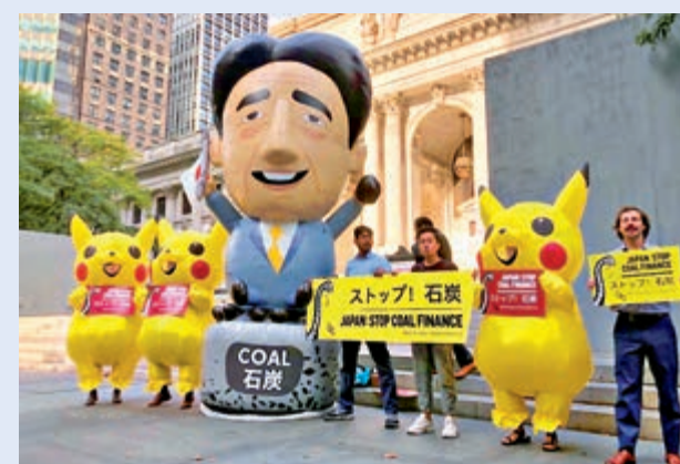
▲環保團體23日立起日本首相安倍晉三的人形氣球抗議

在全球同感氣候變化危機的情況下，抗議活動凸顯日本應對全球暖化的腳步緩慢。國際石油變革組織的一名34歲成員說，七國集團(G7)中至今仍在建造燃煤電廠的只有日本，呼籲「希望為了可再生能源而使用高技術力」。