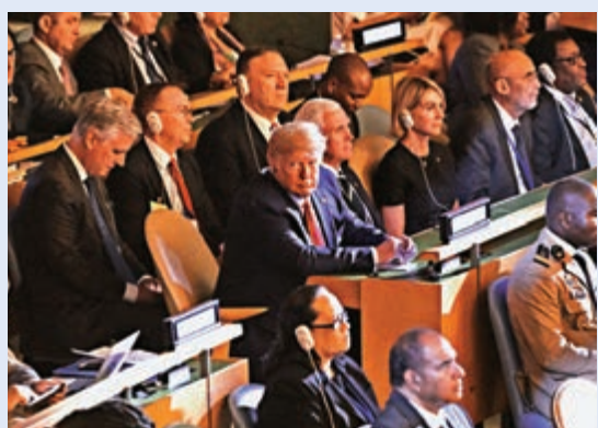
▲特朗普(中)23日短暫出席峰會