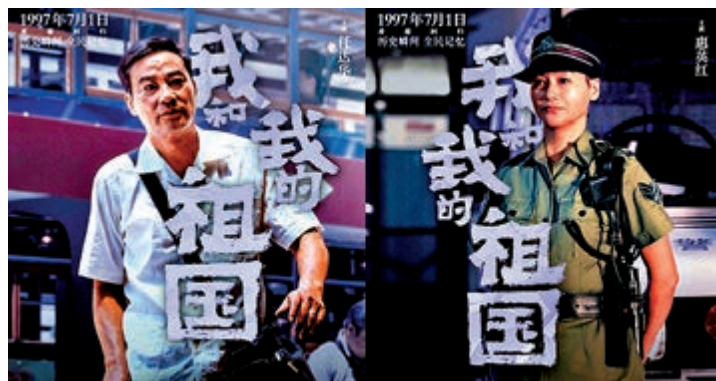
►電影《我和我的祖國》之《回歸》篇