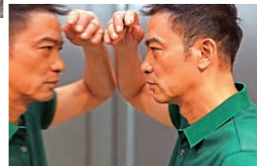
▲任達華稱為電影從業員，要時刻裝備自己