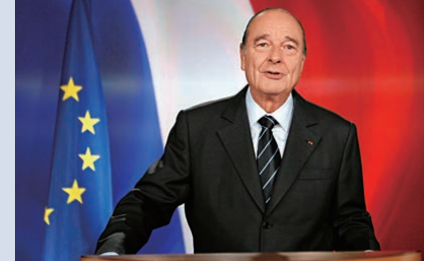
▲法國前總統希拉克2007年在愛麗舍宮發表電視演講