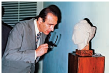
▲1976年，時任法國總理的希拉克在博物館研究佛像 資料圖片