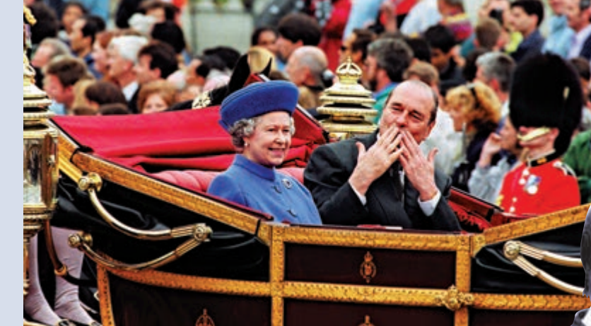
▲希拉克（右）1996年訪英，與英女王乘車時向人群飛吻