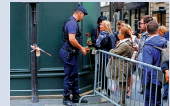
▲警方25日以圍欄圍住希拉克宅邸，巴黎民眾捧花前往悼念