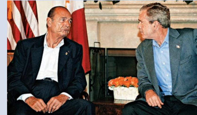
▲希拉克（左）2004年在G8峰會上與美國時任總統小布什會晤時，反覆表示不同意伊拉克戰爭