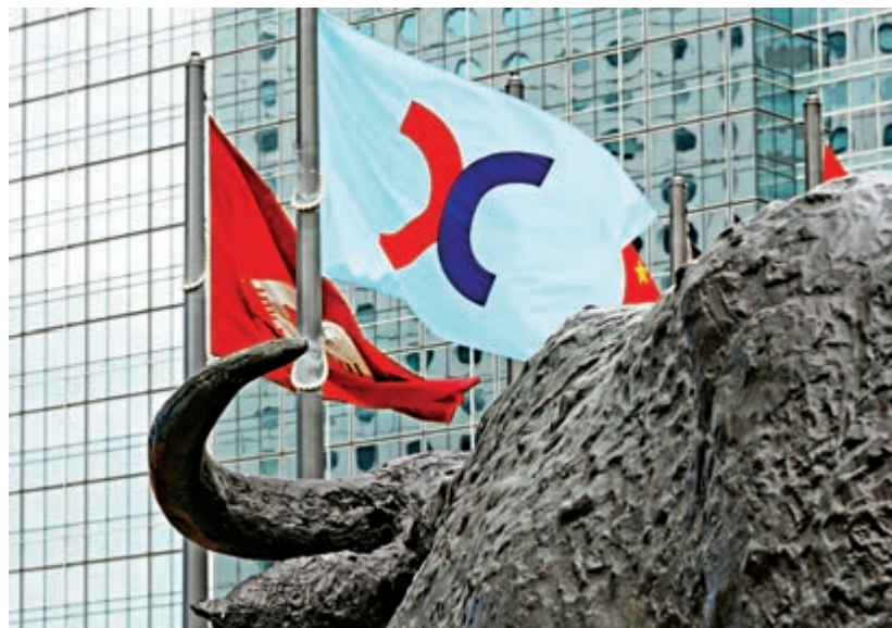
▲暴力衝擊對香港國際金融中心地位有深遠影響，止暴制亂實在刻不容緩

二是中國社會科學院和聯合國人居署共同完成的全球城市競爭力報告，在全球城市經濟競爭力指數排行榜中，深圳、香港、上海、廣州等中國城市位列