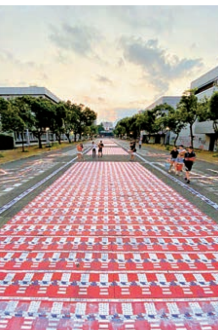
▲中大百萬大道早前被貼滿亂港海報

【大公報訊】記者盧芷嵐報道：在9月25日深夜至26日凌晨，中文大學校園本部多處地點遭不同人士密集噴漆塗污，並以牆紙粉、膠漿張貼單張於地面，校園遭受大面積損污，面目全非。中大早前發表聲明會對任何塗污校園的行為，大學保留作出紀律處分的權利，若涉及刑事毀壞，大學將會嚴肅處理。中文大學研究院舊生會昨日發表聲明，力挺中大校長段崇智