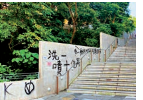
▲中大校園多處遭塗鴉

【大公報訊】記者盧芷嵐報道：在9月25日深夜至26日凌晨，中文大學校園本部多處地點遭不同人士密集噴漆塗污，並以牆紙粉、膠漿張貼單張於地面，校園遭受大面積損污，面目全非。中大早前發表聲明會對任何塗污校園的行為，大學保留作出紀律處分的權利，若涉及刑事毀壞，大學將會嚴肅處理。中文大學研究院舊生會昨日發表聲明，力挺中大校長段崇智