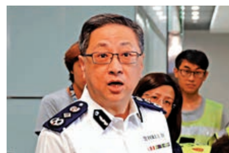
▲盧偉聰表示，警員在生命受嚴重威脅下，為保護自己及同僚，別無選擇才開槍

被推跌後被大批暴徒圍着來打，以尖頭硬物插向警員，其他警員嘗試拯救亦被擲磚，警員迫於無奈開槍後，有暴徒連自己人也不顧，繼續擲汽油彈，反而警員於開槍