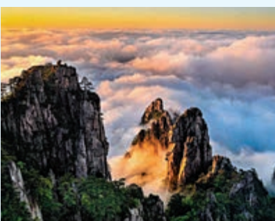
▲黃山景色 資料圖片

在傳統文化方面，香港有兩大使命。首先是要促進香港社會對國家、民族文化的認同。文化是一個國家、一個民族的靈魂。對國家歷史文化的理解和認同，是愛國主義情感培育和發展的根本保證。文化的認同是國家根脈、民族血脈最根本的認同。香港最深層次的問題應該是文化認同的問題。沒有文化的認同，不可能有政治的認同，更不可能有國家的認同。不扎實加深文化認同，熱衷於硬銷政治認同，是香港社會產生極端的重要原因。香港現在尤其需要中國傳統文化的薰陶，也尤其需要中國傳統文化來激發香港同胞血脈中的中國元素，讓以往香港人血濃