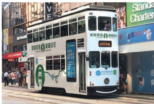
目前僅有一輛冷氣電車，編號為88

香港電車還有一個特色，就是車輛毋須調頭就可以前後行駛，因此在外形上，電車沒有車頭與車尾之分，在發生突發事件和意外時，被困的電車可以靈活地離開。