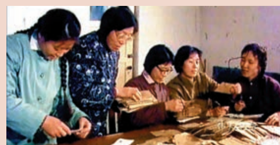
▲內地恢復高考的資料片

《我們走在大路上》在內地取得了不錯的收視率，這不僅是歷史和愛國情懷對人的召喚，也是紀錄片的魅力。