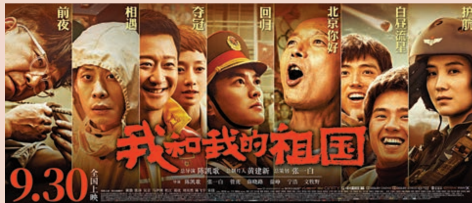
▲電影《我和我的祖國》包含七個章節