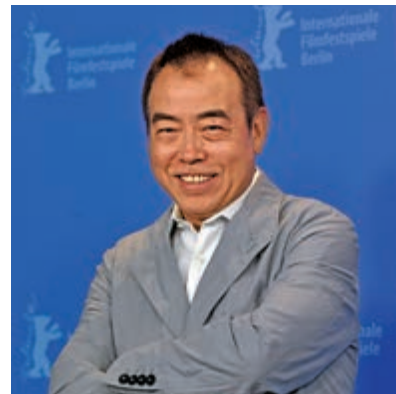
▲陳凱歌出任《我和我的祖國》總導演