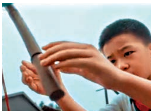
▲《奪冠》以孩子的視角講中國女排三連冠

筆者特別喜歡電影中每個段落之間的過渡。為了將七個相對獨立的故事串在一起，影片在每個故事開始之間安排了一個「書寫歷史」環節，交代故事發生的時間、主要內容，更顯匠心的是會根據每個故事的內容，在細節方面進行調整，比如《前夜》講述的是開國大典前夜的故事，就是毛筆加宣紙，而《奪冠》則是通過小朋友的視角，講中國女排三連冠，「書寫」的就是學生用的鉛筆和田字格。鏡頭雖然不長，但足以令人驚艷於一橫一豎、一撇一捺之間的漢字之美。