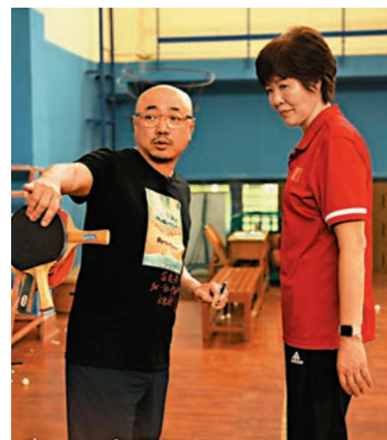
▲徐擘（左）執導其中一個章節《奪冠》，拍攝時中國女排主教練郎平曾往探班