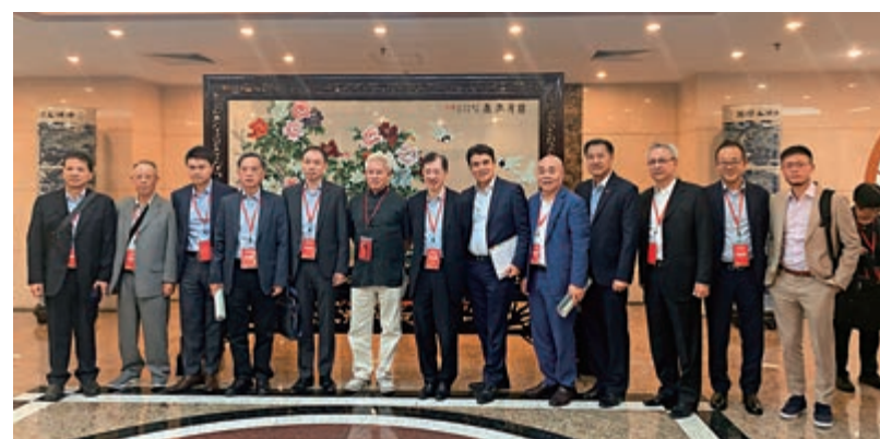
▲訪京團代表合照留影

此外，香港業界代表還就大灣區內的資訊流通、供應鏈競爭力、建立資料中心等與各部委溝通，各部委代表紛紛認同，在大灣區發展創新科技大有可為。