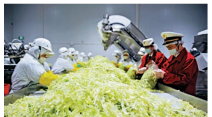
▲高價值的生鮮食品及藥品對冷鏈運輸需求大

發改委代表認為，生物樣本的跨境使用，對深化粵港澳大灣區各城市間創新投入意義重大，期望未來在風險可控的情況下，推動生物樣本的跨境，積極引導有利於創新要素在大灣區內的自由流動，開放管理制度。