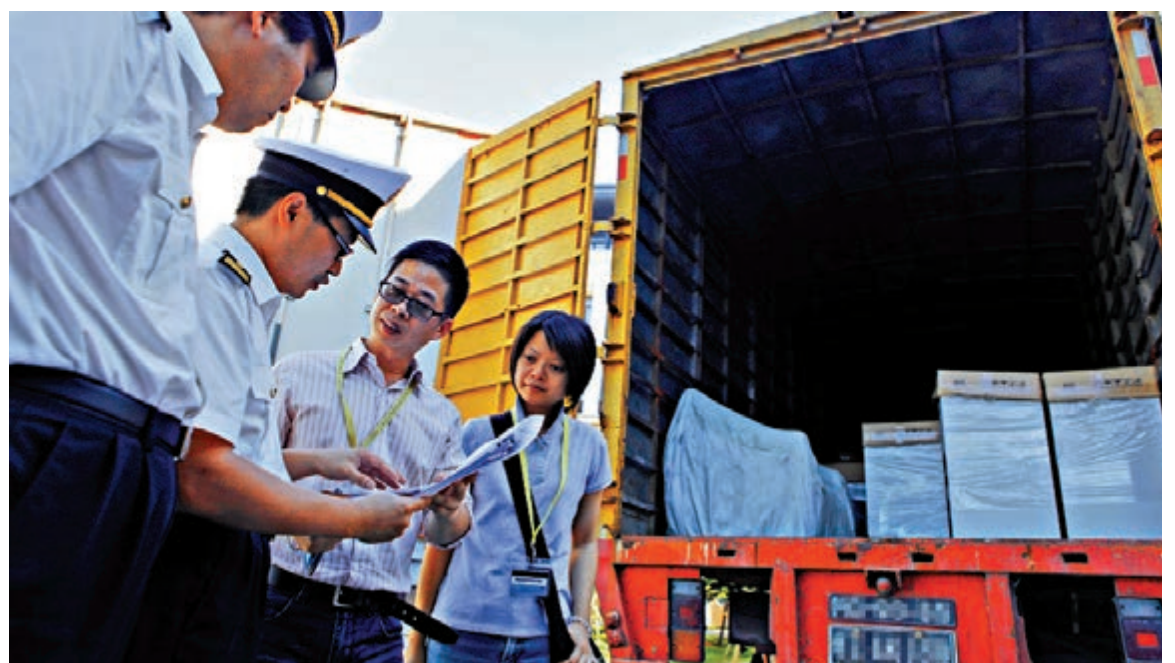
▲業界期望，可建立灣區統一的資料統計機制

為推動粵港澳大灣區的融合發展，黃惠虹還建議，可建立一套統一的資料統計方式和機制。海關總署代表談及，有關大灣區內貿易統一的工作正在推進當中，強調灣區內的合作基礎良好。此外，粵港澳三方較早前已就大灣區對外貿易聯合統計工作舉行工作會議，並制定