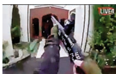
▲新西蘭基督城槍擊案槍手在Fb上直播殺人過程 網絡圖片

【大公報訊】據法新社報道：今年3月發生在新西蘭基督城清真寺等處的嚴重槍擊事件還歷歷在目，真正成為新西蘭「最黑暗一日」。事件發生前後，行兇者竟利用平台直播犯案，行徑令人髮指。