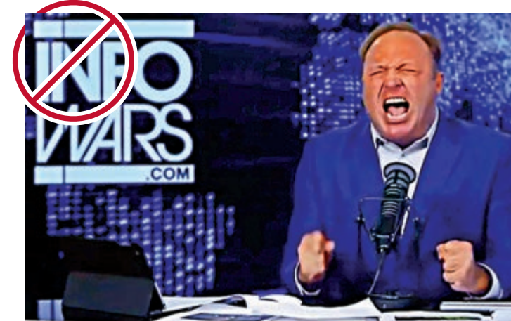
▲右翼博主利用應用軟件Infowars傳播陰謀論和仇恨言論