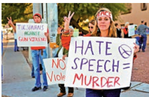
▲網絡上的極端主義和仇恨內容，可能導致青少年逐漸走向暴力之路

的所有人的，這樣帶來的保障感讓社群毋須面對敵意、暴力、歧視或者他人的排斥。最重要的，這些一次次的負面情緒，實質上並沒有解決任何問題，只是導致整個社會的吵吵鬧鬧，傷害、對立與撕裂愈來愈深。