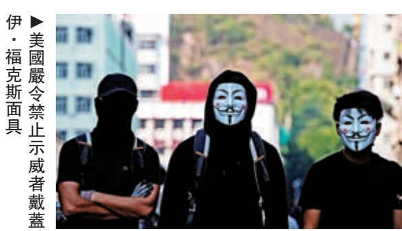
伊·福克斯面具 美國嚴令禁止示威者戴蓋

奧地利則在2002年修訂集會法，引入禁止蒙面條例。但在執行上則採取比較靈活的方式。如果示威者在完