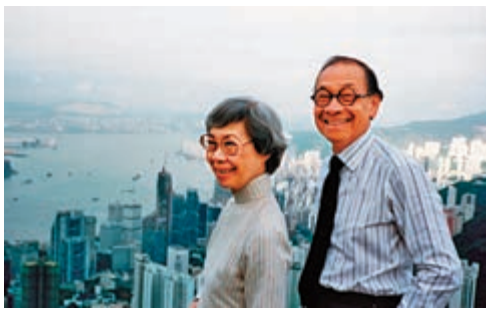
▲貝聿銘夫婦在香港，一九八八年攝

茲（Jacques Lipchitz）、許士騏和野口勇。《無題4，1950》及《無題5，1950》是紐曼於1950年創作的少數畫作，屬於當年創作的六幅作品之二，另有三幅現藏於紐約現代藝術博物館、芝加哥藝術博物館和休斯敦曼尼爾美