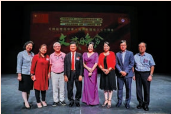
▲眾嘉賓出席「元朗區慶祝中華人民共和國成立七十周年」文藝晚會

【大公報訊】由元朗區慶祝中華人民共和國國慶統籌委員會、元朗區民政事務處主辦的「元朗區慶祝中華人民共和國成立七十周年」文藝晚會於九月三十日晚舉行。在共和國七十華誕前夕，元朗區以豐富多樣的藝術表演，為祖國獻上真誠的祝福。