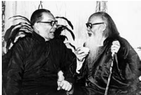
►張大千為黃君璧（左）祝壽場景