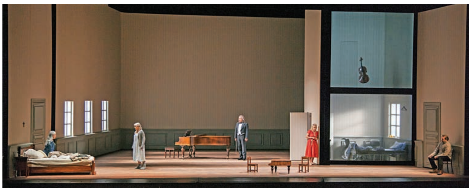
歌劇《秋天奏鳴曲》改編自英瑪褒曼同名電影