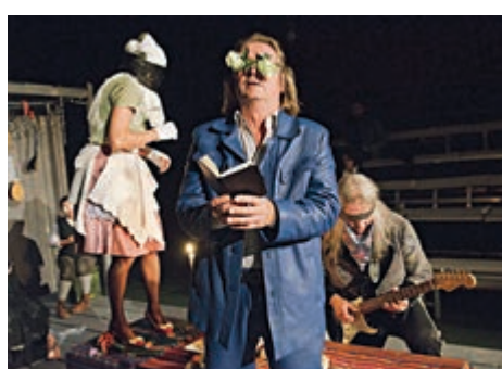
歐丁劇場將演出《慢性人生》