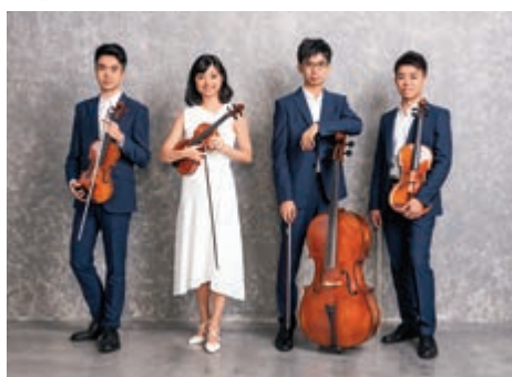
Cong四重奏演出「Nordic Café」系列的北歐作曲家之夜