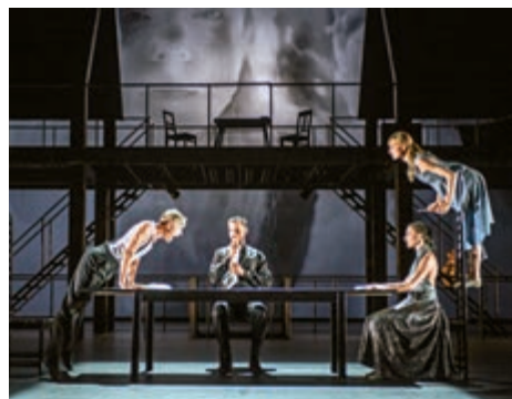
挪威國家芭蕾舞團演繹易卜生劇作《群鬼》

除了連串表演節目外，藝術節亦安排多項延伸活動，包括演後藝人談、講座、工作坊、專題展覽、戶外嘉年華等。門票現於城市售票網(www.urbtix.hk)發售，詳情可電二三七〇一〇四四，或瀏覽www.worldfestival.gov.hk。