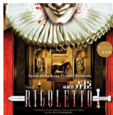
香港歌劇院將呈獻威爾第《弄臣》