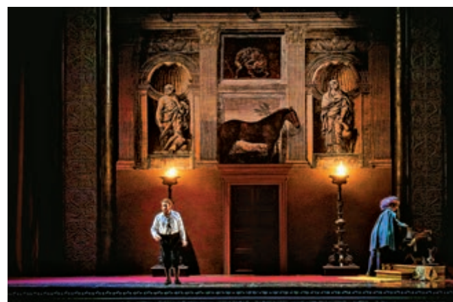
由意大利卡利亞里大劇院製作的《弄臣》去年於意大利演出