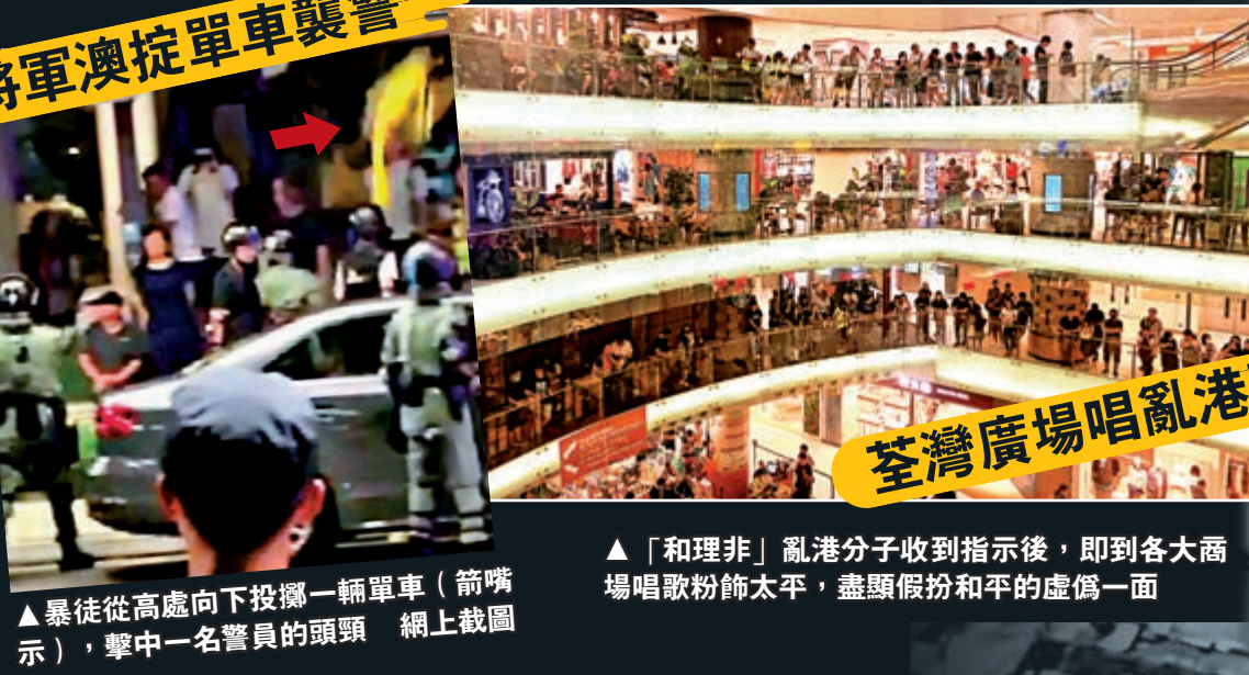
▲暴徒從高處向下投擲一輛單車（箭頭指示），擊中一名警員的頭頸 網上截圖