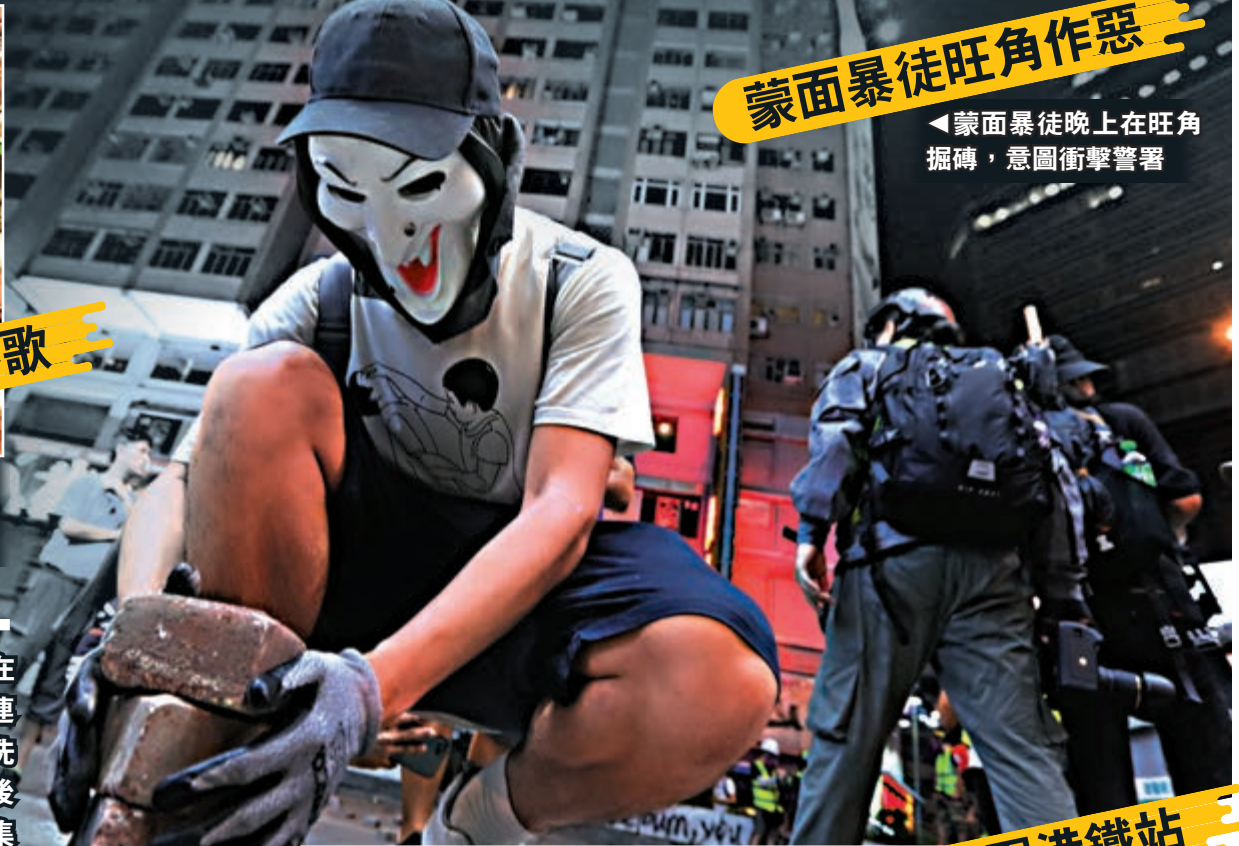
▲蒙面暴徒晚上在旺角掘磚，意圖衝擊警署