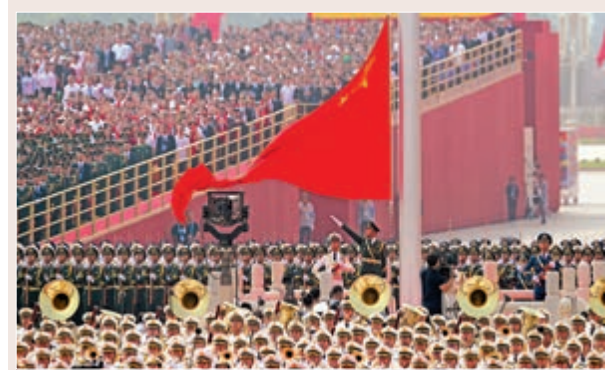
慶典大會升旗儀式莊嚴

國慶當天，大灣區之聲亦實現了首次用粵語直播國慶盛典，之後4K粵語版《此時此刻——國慶70周年慶典》於十月二日登陸粵港澳大灣區八十家影院，影片由知名粵語主持人陳星、曉東以粵語配音解說。