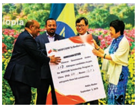
▲阿比(左二)9月5日在中國駐埃塞俄比亞大使館參加埃赴中援外培訓學員聯誼會 新華社

除貿易往來，阿比還提倡兩國進行文化深入交流。中國駐埃塞俄比亞大使館9月舉辦埃赴中援外培訓學員聯誼會，向228名埃學員頒發了集體入學通知書，為他們提供赴中國攻讀碩博學位的獎學金。阿比鼓勵這批學員要積極學習中國不同領域的發展經驗和做法，努力研究中國發展方式，為國家發展做出貢獻。