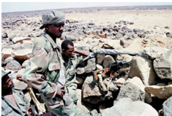
▲2000年5月位於兩國爭議地區布雷的厄立特里亞士兵

當時，許多人憂心EPRDF內部會發生權力鬥爭，甚至令聯合政府瓦解，於是執政聯盟推選阿比成為該國首位奧羅莫人總理。阿比上任後積極推動可能造成該國社會混亂、重疊跨越國界變革動力的政策。近期，他又轉向充實經濟願景，同時為定於明年5月的大選奠定基礎。然而，分析家擔憂阿比的政策對政壇老將來說太多太慢，對國內的憤青來說又太少太慢。