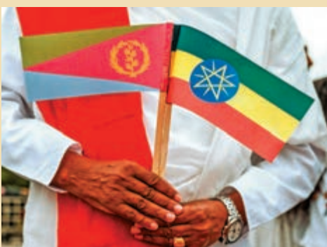
▲埃塞民眾去年11月拿着兩國國旗迎接厄立特里亞總統到訪