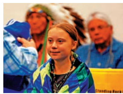
▲瑞典少女通貝里8日在美國北達科他州的原住民部落參加青年領袖座談會

做過的很多事都值得獲獎，可惜諾貝爾獎並不公平」，暗中表達對2009年前美國總統奧巴馬上任僅九個月就獲和平獎表示不滿。