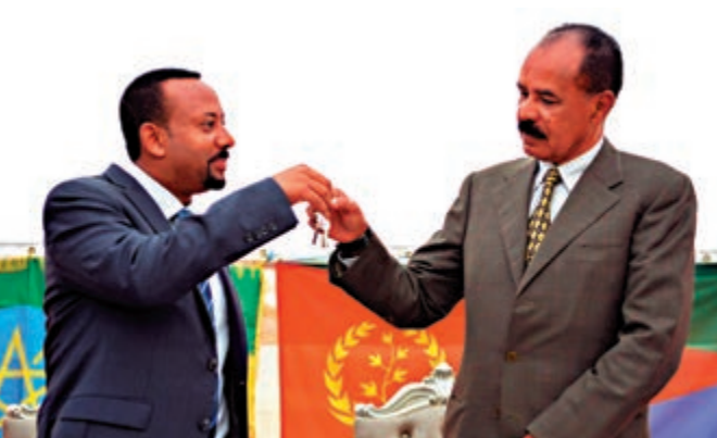
▲埃塞俄比亞總理阿比(左)和厄立特里亞總統伊薩亞斯交換象徵和平的鑰匙 網絡圖片