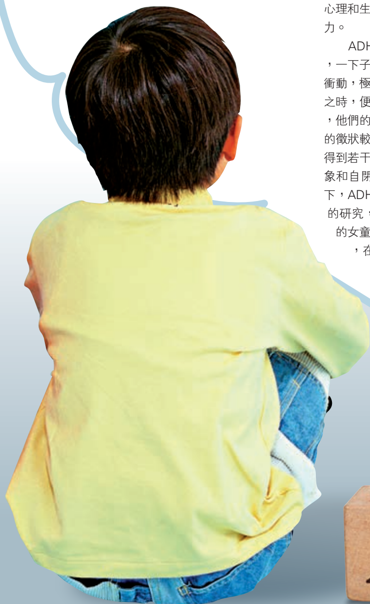
◀有說患ADHD的男童比女童多，其實並不正確