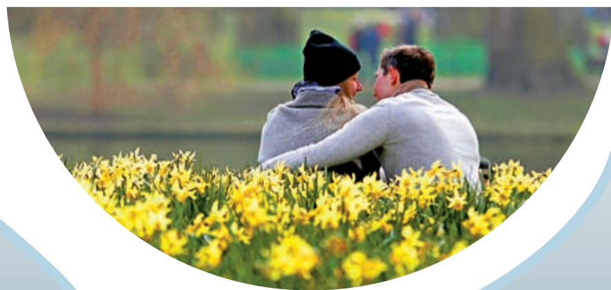
◀性取向是天生還是受後天影響，至今未有定論

筆者個人認為醫學知識因研究新發現，有長足進步，造福人類，修正謬誤，改善生活質素，蕩滌心情，當然是好事。但是一個科學組織的決定，滲入「政治考慮」，這樣或者會自毀長城。