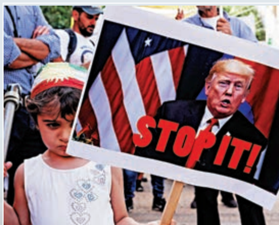
◀塞浦路斯民眾12日在首都尼科西亞舉行反美示威，抗議土耳其其進攻敘利亞

聯合國駐敘利亞人道主義協調員里達11日發表媒體聲明說，自土耳其9日在敘東北部展開軍事行動以來，已造成約10萬平民逃離家園。交戰還造成敘東北部哈塞克省一座重要的水站停運，由於衝突持續，維修人員無法抵達水站。該水站是哈塞克市及其周邊地區約40萬居民的用水來源。此外，連日來交戰地區的市場、學校和診所都已關閉，只有一家公立醫院尚在運行。