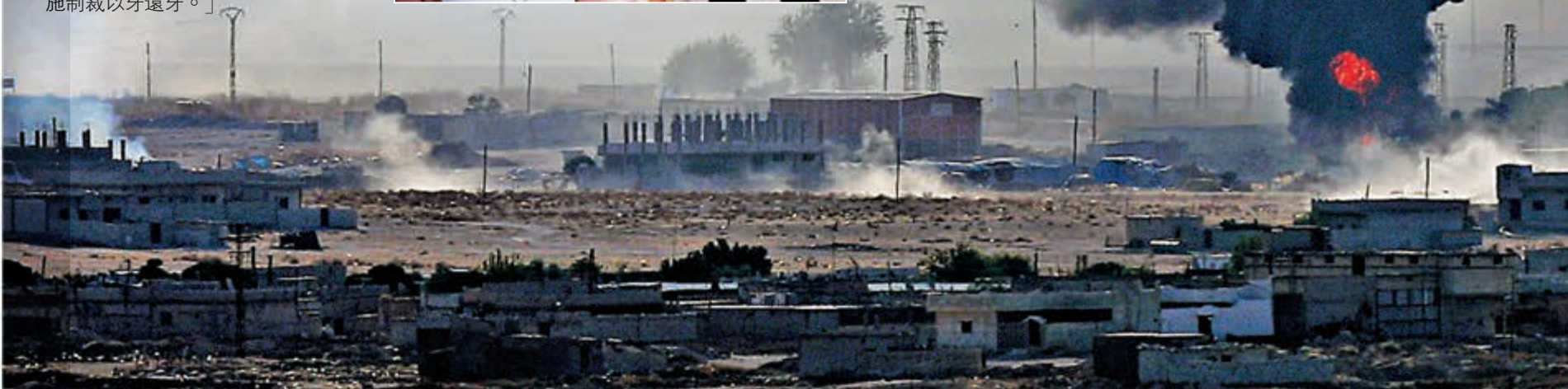
▼土敘邊界12日多處發生爆炸起火