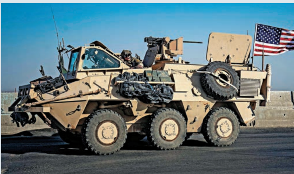
▶美國軍車12日在敘利亞東北部巡邏