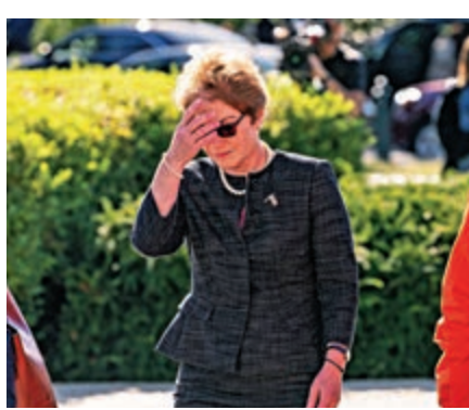
▲前美國駐烏克蘭大使約萬諾維奇11日出席眾議院閉門聽證會

10日，兩位與朱利安尼有聯繫的美國商人以在競選募款中存在違規操作被捕。對於這兩人的指控中包括幫助一名美國會議員募款，以此換取該議員助力解除約萬諾維奇職務。有報道稱，這兩人可能在為烏克蘭做事。