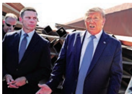
▲美國總統特朗普和代理國土安全部長麥卡利南（左）

特朗普上任以來，白宫不斷收緊移民政策：一方面嚴厲打擊和抓捕非法移民，修築邊境牆；另一方面，填補制度漏洞，提高合法移民入境或居留美國的門檻。儘管政策目標明確，但特朗普政府在執行層面卻面臨國土安全領導層持續不穩定狀態。除了部長一職目前空缺，該部下屬的海關和邊境保護局、移民和海關執法局、公民和移民服務局局長均為「代理」狀態。