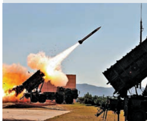
▲「愛國者」導彈系統 資料圖片