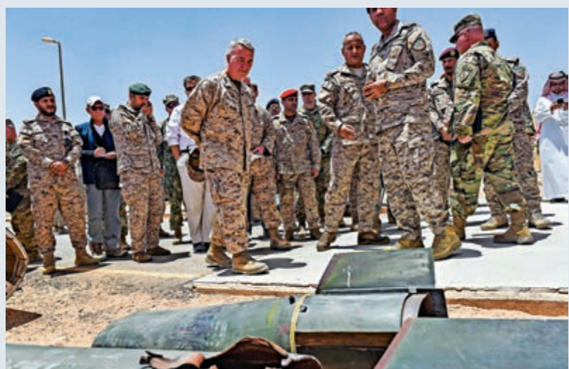
▲美軍多名將領7月18日造訪沙特一處軍事基地 資料圖片

【大公報訊】綜合CNN、路透社報道：當地時間11日，伊朗油輪「薩比蒂號」在沙特吉達港附近的紅海海域發生爆炸，伊朗方面稱油輪遭到兩枚導彈襲擊。在中東緊張局勢再度加劇之際，美國國防部11日宣布，美軍確認再向沙特增派約1800名士兵及防空、反導軍事裝備。連同之前的兩次派兵，美國已向沙特增兵約3000人。