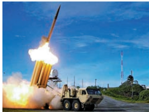
▲「薩德」反導系統 資料圖片

五角大樓發言人霍夫曼在當天發表聲明說，應美軍中央司令部要求，美防長埃斯珀批准向沙特增派美軍和裝備，包括兩個戰鬥機中隊、一支空軍遠征聯隊、兩套「愛國者」導彈系統和一套「薩德」反導系統。