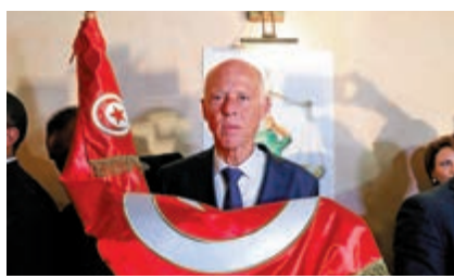
突尼斯總統候選人賽義德13日宣布勝選

不過，儘管約翰遜開出長長的願望清單，但由於保守黨目前在下議院未取得多數，其施政方針的執行能力具有高度不確定性。反對黨工黨認為，女王被保守黨利用，幫助約翰遜發布了一份選舉宣言。工黨黨魁郝爾彬13日說：「我們得到的實際上是一場政黨通過王位進行的政治廣播。」