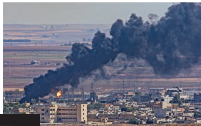
土耳其13日空襲敘利亞境內的拉斯艾因

【大公報訊】綜合《紐約時報》、BBC、法新社報道：敘利亞境內的庫爾德族武裝6日被長期盟友美國拋棄後，遭到土耳其軍隊連日轟炸。為了自保，庫族軍隊13日轉而求助敵對的敘利亞政府，以讓出幾座重要城市為條件，換取對方保護。這是美國從敘北撤軍後的形勢重大轉折。