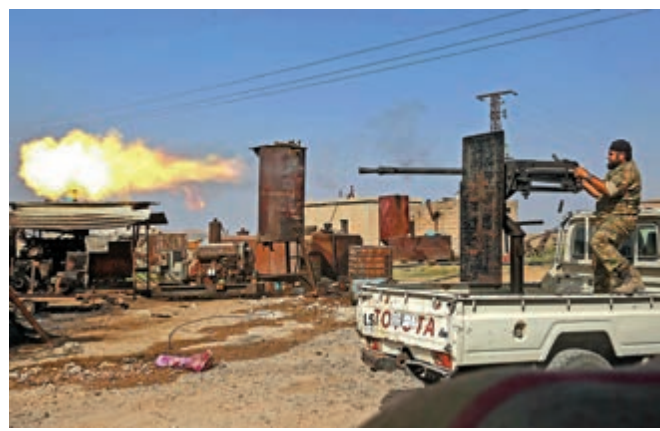
土耳其支持的敘利亞反叛軍向拉斯艾因開火