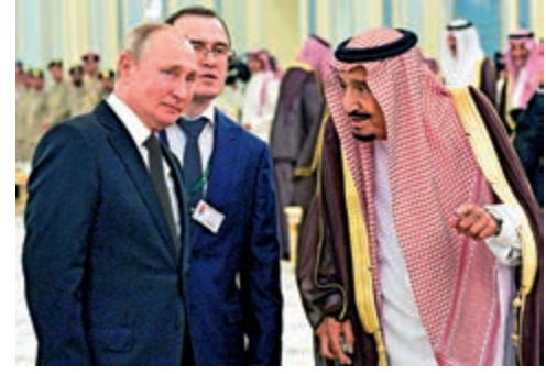
俄羅斯總統普京(左)14日與沙特國王薩勒曼會晤

據俄媒體報道，普京此行可能會當面游說沙特購買俄防空系統。儘管沙特引進了美國「薩德」系統，但油田遇襲事件表明「薩德」不能有效抵禦襲擊，普京此訪將推動俄沙軍事合作。