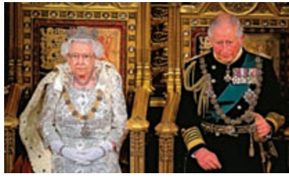
英女王(左)14日在議會發表演講